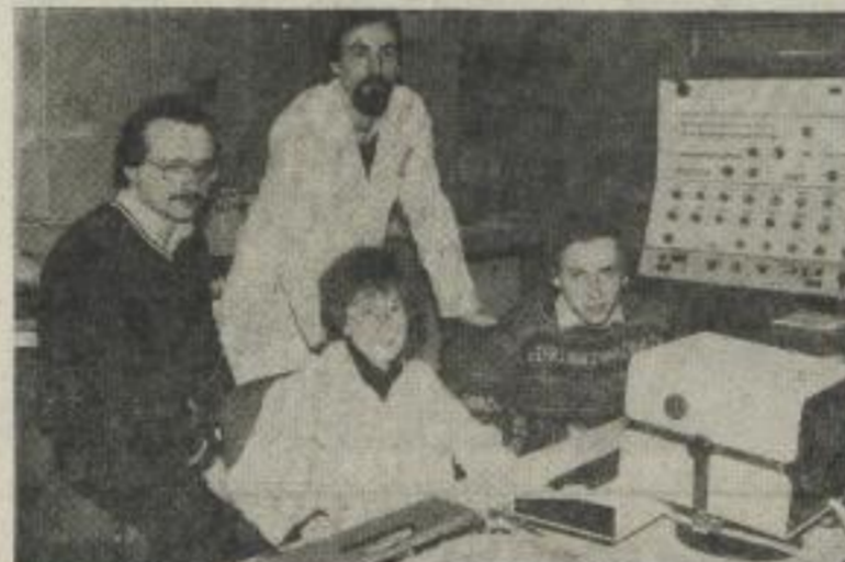
Im Rahmen des Wettbewerbes der Jugendbrigaden wurde die Jugendbrigade des Betriebsteiles 2 des ORZ ausgezeichnet.