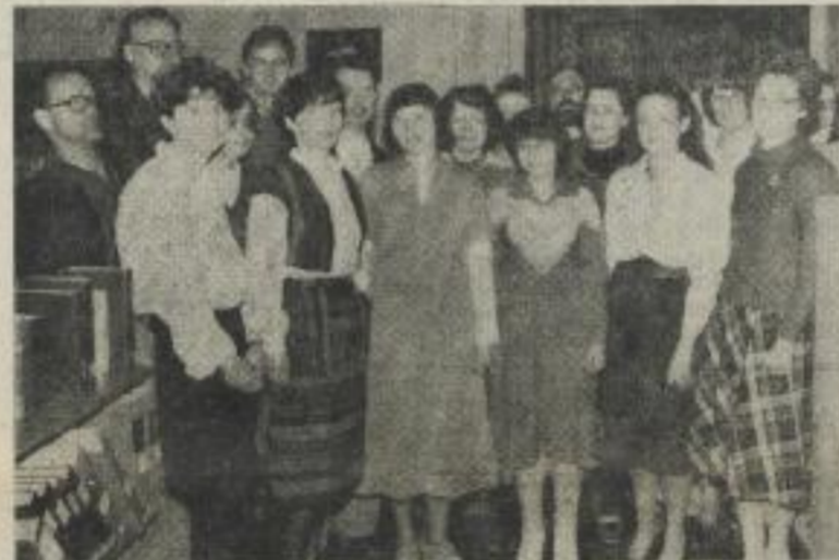
Hervorragende Leistungen vollbrachte das Kollektiv der Katalogabteilung der UB bei der Einarbeitung aller Buch- und Zeitschriftenbestände.