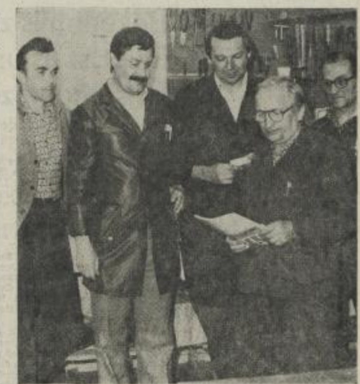
Das Kollektiv Bettenhaus II (Technik) sichert durch seine verantwortungsvolle Tätigkeit das störungsfreie Arbeiten aller Stationen und Bereiche im Bettenhaus.

Dieses Kollektiv hat hohe Leistungen bei der ordnungsgemäßen Bedienung der EDVA 1040/2 im durchgängigen 3-Schicht-System aufzuweisen. Trotz technischer bedingter Ausfallzeiten konnte dank des initiativreichen Handelns und hohen persönlichen Einsatzes der Plan erfüllt werden. Gute Erfolge sind weiterhin in der Lehrlingsausbildung aufzuweisen.