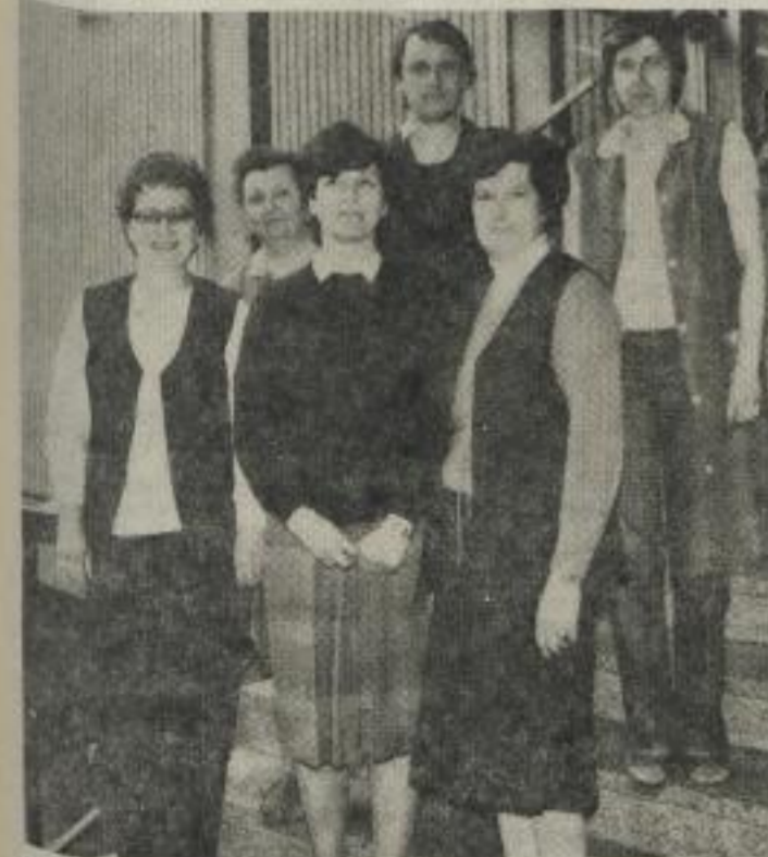
Das Kollektiv Verwaltung Hörsaalgebäude/Seminargebäude der Universitätsverwaltung Stadtmitte wurde als bestes im sozialistischen Wettbewerb geehrt.