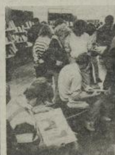
Trotz großen Andrangs: vom Blättern lößt sich keiner abhalten.