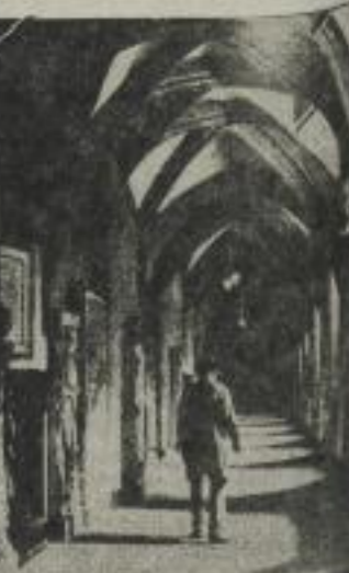
Aus einem alten Leipziger Kolonnaden der Kreuzgang der Pauliner Kirche.