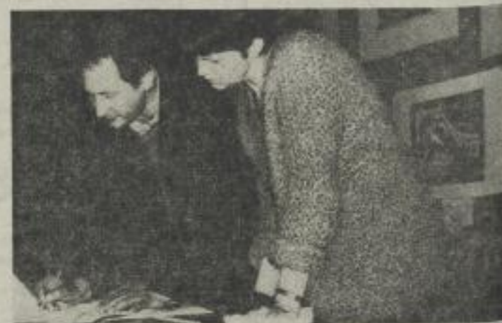
Seit 20 Jahren arbeitet am Bereich Medizin ein Mal- und Zeichenzirkel, in dem nicht nur Mediziner ihrem künstlerischen Hobby nachgehen...