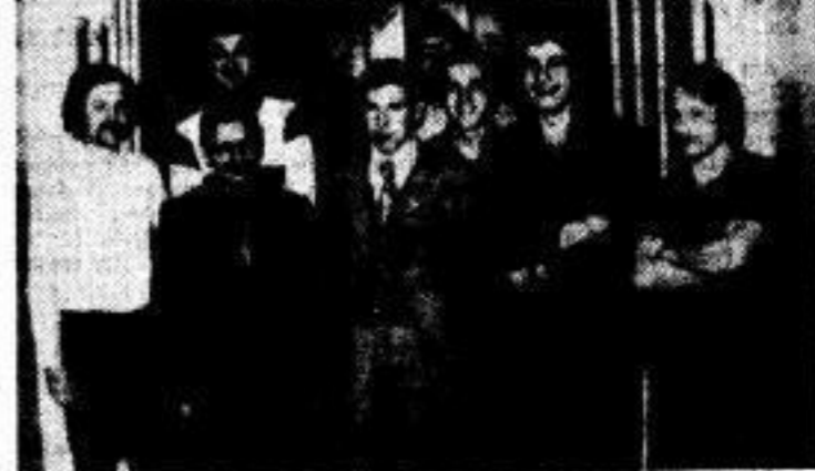
Die Delegation des MEI mit ihren Betreuern.