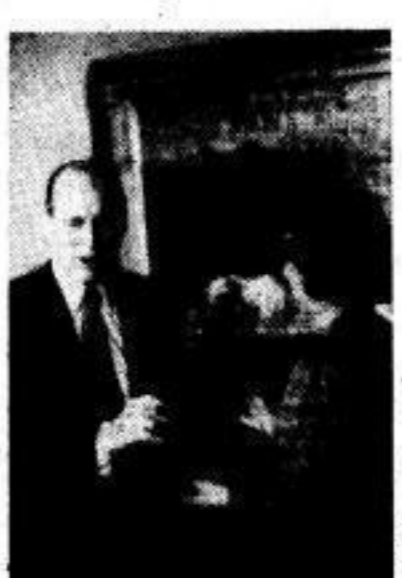
Dank an Professor Manfred von Ardenne.