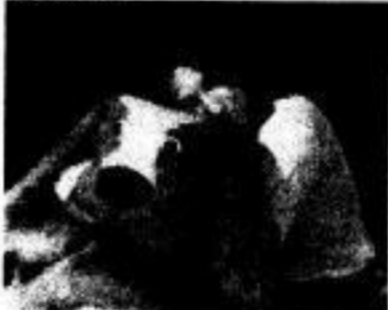
Wie dieses Foto beweist, sind die „laufenden Männerbesuche“ bei Studentin Silke E. reine Erfindung.