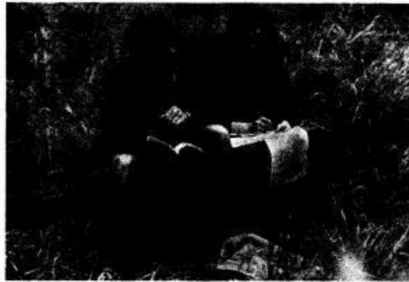
Die Studenten H. A. und G. S. (Sektion 21) haben sich wieder einmal im Wald verlaufen. Wegen der feuchtkalten Witterung wollen sie sich diesmal die Zeit bis zum Aufgang des Polarsterns durch Studien in ihren Vorlesungskripten vertreiben.