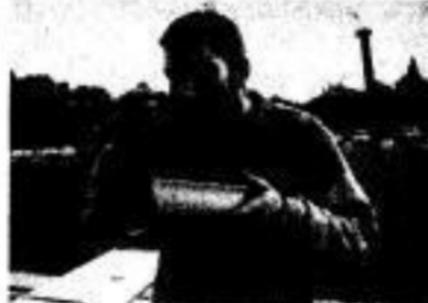
Neue Regelung: Bei Gerichten mit Vorsuppe Einnahme derselben bereits vor der Mensa!