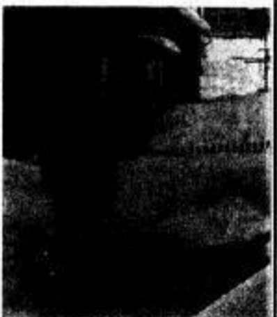
Das neue Verfahren zur künstlichen Erzeugung von Schnee, das an der TU entwickelt wird (UZ 24/84 berichtete darüber) wurde in M. großflächig erprobt und führte zu ersten Beschwerden der Bevölkerung.