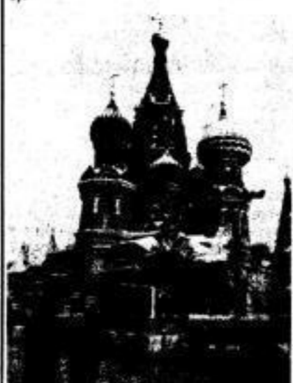
Die Basilika-Kathedrale in Moskau.