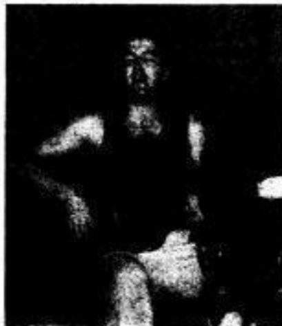
Ende September präsentierte der FDJ-Studentenklub Neue Mensa Gerhard Schöne und seine Gruppe mit zwei Konzerten im Hörsaal des Barkhausen-Baus. So konnten viele die Möglichkeit nutzen, einen der beliebtesten Liedermacher live zu erleben. Der es hervorragend verstand, alle Anwesenden mit seiner großen Palette - angefangen von Kinderliedern bis hin zu anspruchsvollen Balladen - zu begeistern.