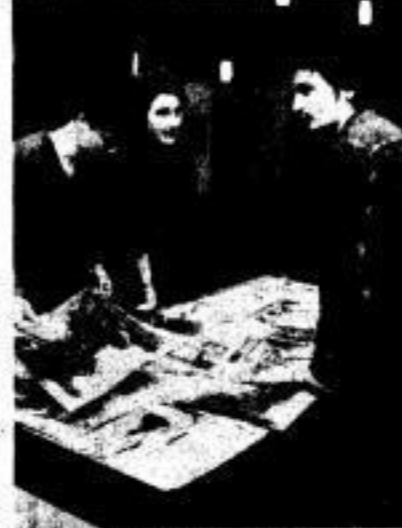
Viele Interessenten fanden sich auch an den Ständen des Mal- und Zeichnerzirkels (Foto links), der Textildesignzirkel (rechts) und des Fotozirkels ein. In diesem Zusammenhang sei ein Besuch der Zentralen Volkskunstausstellung im Hörsaalgebäude Willersbau empfohlen.