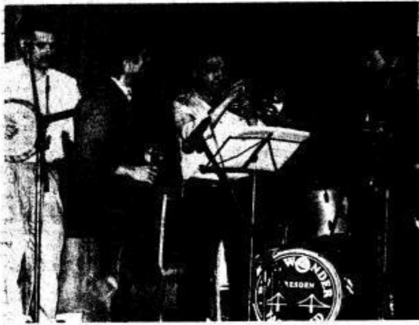
Beschwingter Auftakt zum „Tag des Volkskünstlers“: Moderne Melodien des Bläserorchesters unseres Zentralen FDJ-Studentenklubs sowie die zündenden Rhythmen der Blue Wonder Jazz Band Dresden (Foto). Im Otto-Buchwitz-Saal konzertierte das Sinfonieorchester der Gewerkschaft Wissenschaft der TU Dresden.