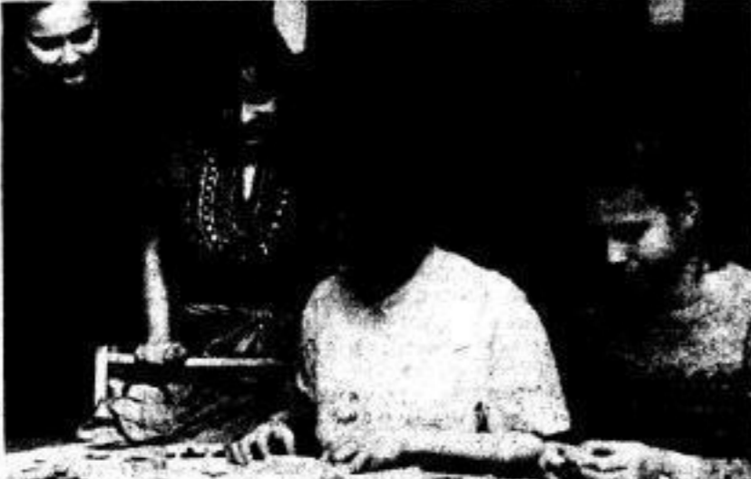
Die Konsultationsstützpunkte der zahlreichen Zirkel demonstrierten verschiedene Techniken und regten manchen Besucher an, sich darin zu versuchen.