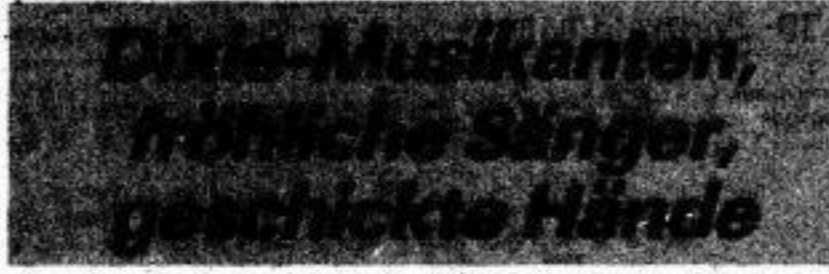
Unsere 5. Universitätsfestspiele vom 13. bis 30. November 1987 standen ganz im Zeichen des 70. Jahrestages der Großen Sozialistischen Oktoberrevolution. Die Angehörigen der TU würdigten dieses Jubiläum mit hohen Leistungen bei der weiteren konsequenten Verwirklichung der Beschlüsse des XI. Parteitag der SED. Getreu den Idealen des Roten Oktober errangen die Wissenschaftler, Studenten, Arbeiter und Angestellten unserer Universität Hervorragendes im sozialistischen Wettbewerb und zogen auch auf dem Gebiet des volkskünstlerischen Schaffens eine gute Bilanz. Über das Erreichte bei der Gestaltung eines anspruchsvollen geistig-kulturellen Lebens legten die 5. Universitätsfestspiele vielfältig Rechenschaft ab. Charakteristisch war, daß sie durch zahlreiche Volkskünstler, Gewerkschafts- und FDJ-Kollektive der TU ideenreich und engagiert mitgestaltet wurden. Mit großer Freude konnten wir auch sowjetische Ensembles begrüßen, die anlässlich der Leningrader Tage 1987 in Dresden weilten und unser Festprogramm bereicherten. Dank gebührt allen, die uns zu den Festspieletagen nach fleißigen Proben und intensiver Vorarbeit eindrucksvolle Beweise ihres Talents und Könnens gaben, auch neue Bedürfnisse zum Mitmachen weckten. Auf dieser Seite einige optische Eindrücke vom „Tag des Volkskünstlers“ am 18. 11. 1987 in allen Räumen der Mensa Mommsenstraße.