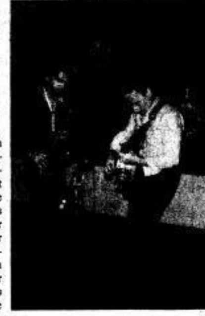
Zu den „Leningrader Tagen '87“, zum 5. Mal in Dresden, bot die Dixielandgruppe aus Leningrad in der Mensa Mommsenstraße begeisterte Virtuosität.