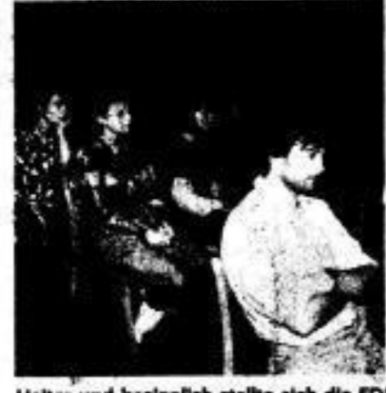
Heiter und besinnlich stellte sich die FDJ-Singegruppe „Punktum“ (Foto) den Zuhörern vor. Ihre Kommilitonen sparten nicht mit verdientem Beifall. Für Stimmung sorgte an diesem Abend auch die Folkloregruppe „Quickborn“ der TU.