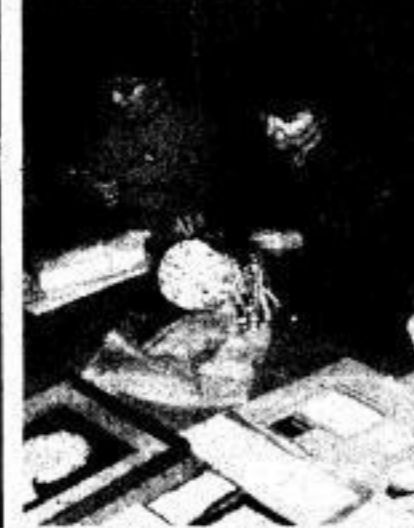
Eine in ihr anspruchsvolles Hobby gaben auch die Mitglieder der Keramikzirkels der Gewerkschaft.