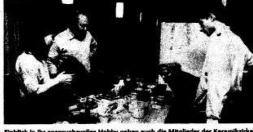
Eine in ihr anspruchsvolles Hobby gaben auch die Mitglieder der Keramikzirkels der Gewerkschaft.