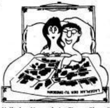
„Helft den Neuen beim Eingewöhnen!“

A Ankunft in unserer Technischen Universität. Allen „Neuen“ ein herzliches Willkommen, erfolgreiche Jahre in der schönen Stadt Dresden und natürlich das Beste fürs Studium! Ein besonderer Gruß gilt allen ausländischen Studenten.