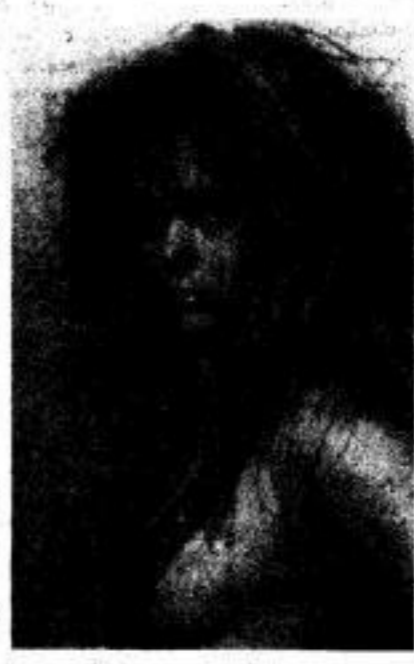
„UZ“ möchte nochmals nachdrücklich darauf hinweisen, daß der Lehrkörper von den Prüflingen exakte Bekleidung erwartet.