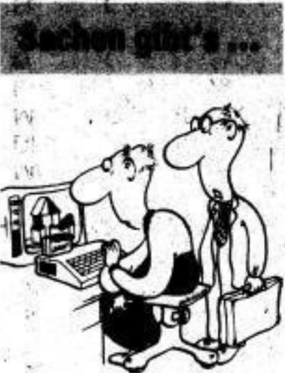
„Überleg noch mal genau, ob die Kasette nicht doch zu Hause in die falschen Hände geraten ist.“