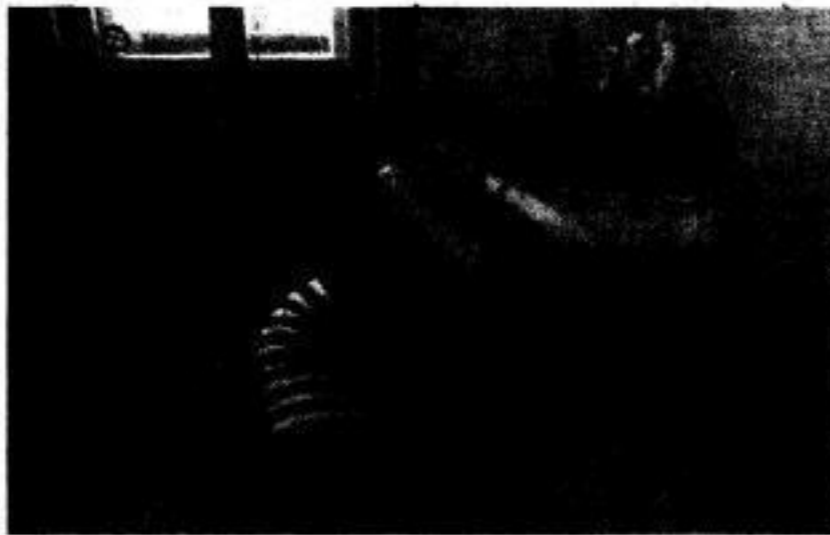
Die Bewohner des Studentenwohnheimes Budapeststraße 22 wollen alle Tische abschaffen! Sie sind der Meinung, daß man bei ihnen auch vom Fußboden essen kann.

Zwei Computer unter sich: „Warum schautst du so betrübt drein?“ Klagt der andere: „Mein Programmierer versteht mich nicht!“