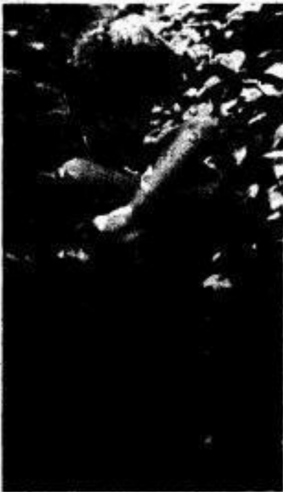
Subtropische Klimabedingungen im Botanischen Garten unserer Universität lassen Flora und Fauna in ansprechender Weise gedeihen.

Es war ein Student aus Schmalkalden, der hatte Talent zum Gestalten. Er schnitt sein Gefühl ins Hörsaalgestühl - Dort bleibt es der Nachwelt erhalten!