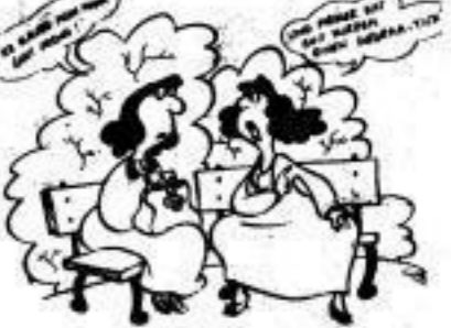
„Ich glaube, mein Mann geht fremd!“ „Und meiner hat seit kurzem einen Informant.“