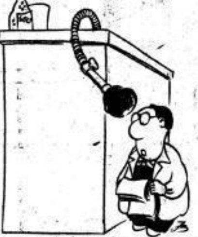
„Ich spreche jetzt über das Problem der Mikroelektronik.“