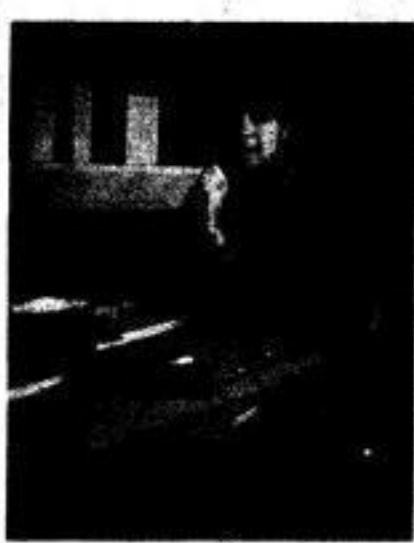
Die Redaktion bittet von der Zusendung bissiger Leserbriefe Abstand zu nehmen: Es ist ja alles gar nicht so gemeint!