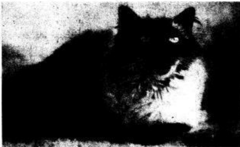
Tagtraum einer Hochschulmiese: Heute Abend ist Disco, da laß' ich mich kraluen.

Und hier ist sie wieder: die Foto-Morgana der UZ