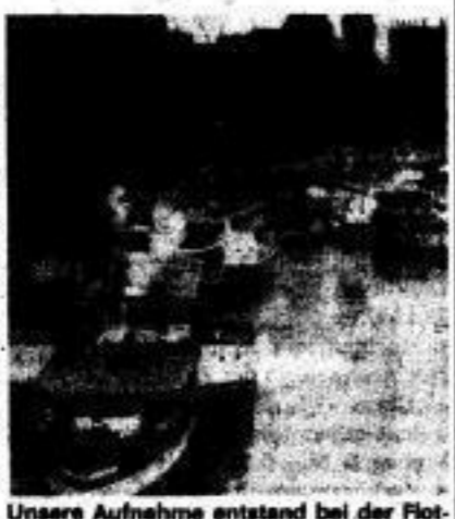
Unsere Aufnahme entstand bei der Flottenparade 1988.

Am 1. April 1989 wurde mit der Fahrt des Motorschiffes 'Lilienstern' die Saison für die Dresdner 'Weiße Flotte' eröffnet. Es ist die 153. Saison der Personenschifffahrt auf der Elbe.