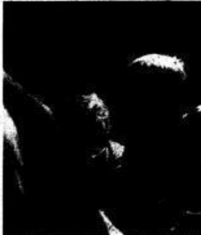
U. H.