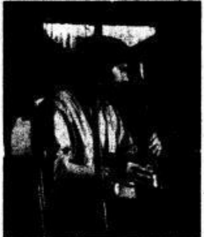
Im Güntzklub gastierte am 16. März 1989 die Gruppe 'Medita': meditative Musik zum Nachdenken und Mitfühlen, mit freizeigen Elementen eine interessante Mischung. Der Gitarrist der Gruppe ist uns noch aus der Formation 'Yetra' bekannt. Diesmal ohne Sitar, doch dafür mit großem Schlagwerk, brachte das Zweimannprojekt seiner zahlreichen Hörerschaft Musik der indischen, tibetischen und nepalesischen Region nahe.