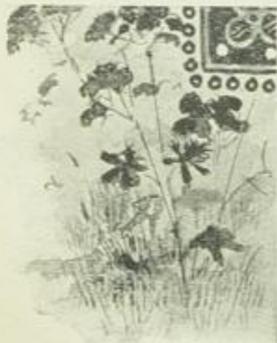
Stadtpark Lindners Ruh.