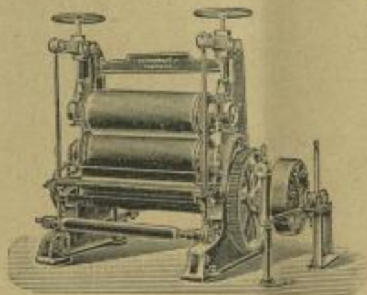
Matt- und Roll-Calander.