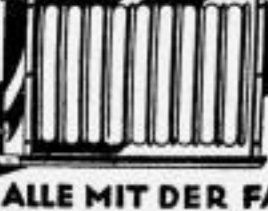
Der Standard-Lautsprecher ARCOPHON 3 RM 73.-