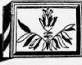
Der Volks-Lautsprecher ARCOPHON 42 RM 42.-