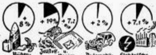
Zeichnung: Eufimnat (M.)