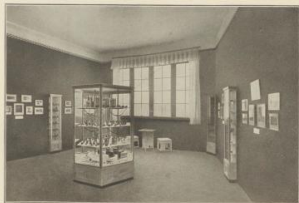
HUGO MEYER & Co., OPTISCH-MECHANISCHE INDUSTRIE-ANSTALT, GÖRLITZ