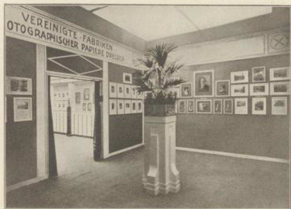
VEREINIGTE FABRIKEN PHOTOGRAPHISCHER PAPIERE, DRESDEN