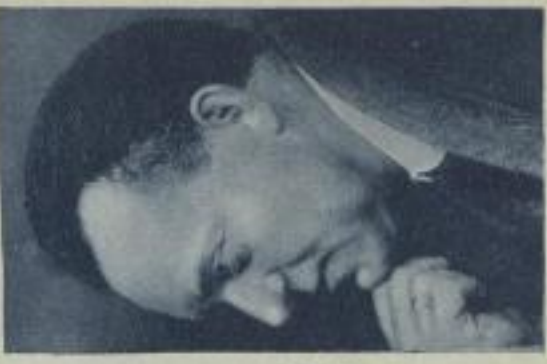
Karl Haas Strobl, der bekannte Romanschichtführer, wurde 60 Jahre alt