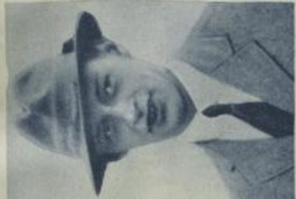
Links: Prinz Wilhelm von Preußen, der 1906 geborene Alteson Sohn des kaiserlichen Kronprinzen