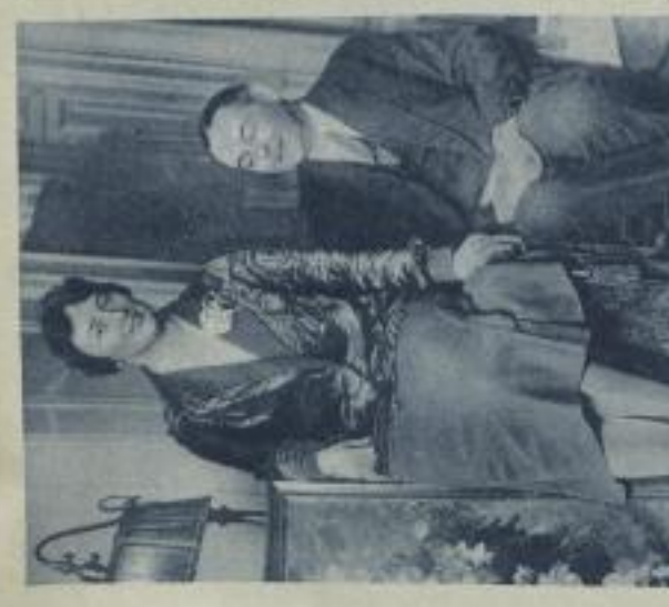
Frau Viktoria Baumann, die frühere Prinzessin August-Wilhelm von Preußen, mit ihrem Gatten in ihrer New Yorker Wohnung. Früher eine der gefürchtesten Schönheiten des Kaiserhauses, lobt sie heute in einfachen Verhältnissen. Die 1888 geschlossene Ehe der früheren Prinzessin Alexandra Viktoria von Schleswig-Holstein-Sonderburg-Glücksburg wurde 1920 geschieden