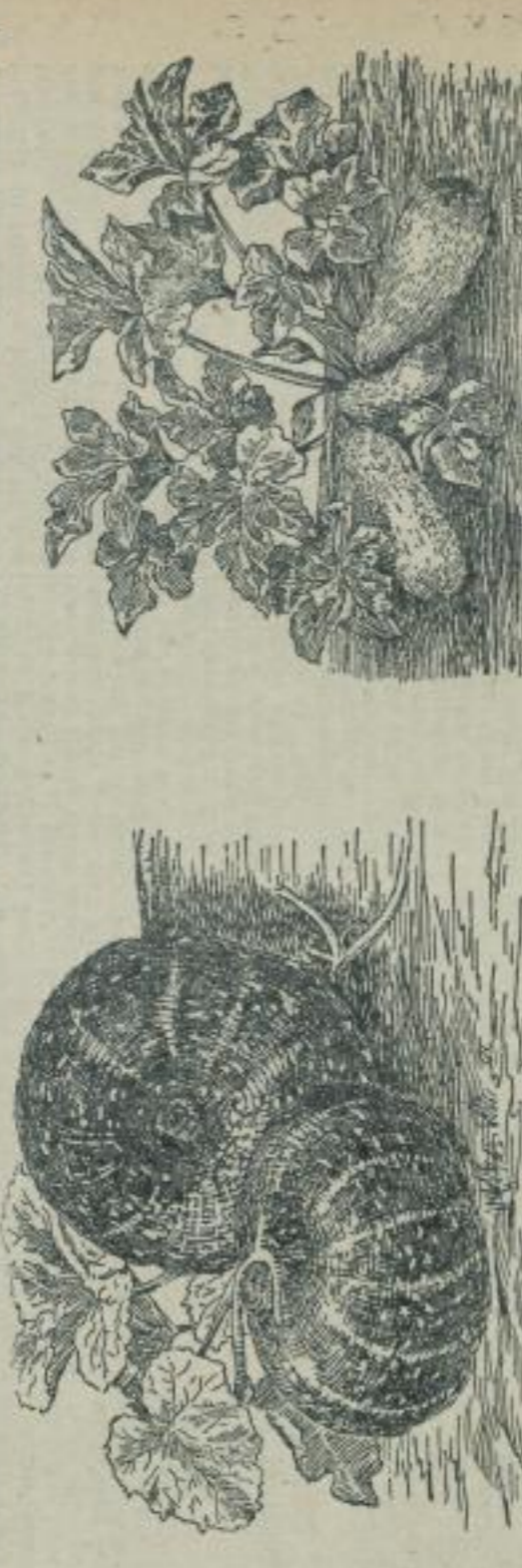
Die Welt der Pflanzen, Tiere und Menschen ist ein wunderbares Schauspiel. Es ist ein Schauspiel, das in der Welt der Pflanzen, Tiere und Menschen eine besondere Rolle spielt. Es ist ein Schauspiel, das in der Welt der Pflanzen, Tiere und Menschen eine besondere Rolle spielt.