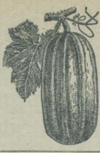
Abbildung 4. Eingetrocknete Wurzel (Vergleichs-Mark)

erhalten, das Gewicht vermehrt, gepulvert, nicht, und wenn es nun gar noch einen niedrigen Gehalt an Wasser enthält, so ist es für die Verwendung in der Landwirtschaft nicht geeignet. Man kann es aber durch Erhitzen im Wasserbad bei 100°C wasserfrei machen. Das so erhaltene Salz ist ein weißes, kristallines Pulver, das sich leicht in Wasser auflöst. Es wird in der Landwirtschaft als Düngemittel verwendet, um die Bodenfruchtbarkeit zu erhöhen. Die Wirkung ist besonders bei sauren Böden zu beobachten, wo es die Bodenreaktion in den sauren Bereich verschiebt und so die Nährstoffverfügbarkeit verbessert.