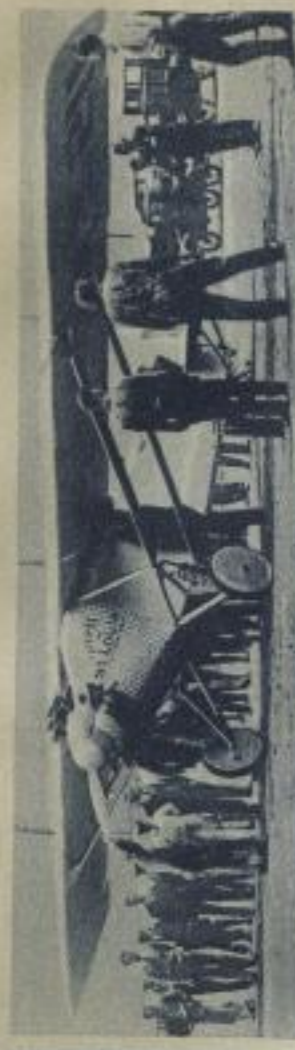
Das Ozeanflugzeug! Der Eindecker „Spirit of St. Louis“, mit dem Kapitän Charles Lindbergh in 30 Stunden von New York nach Paris flog. Der Eindecker hatte nur einen Motor und war nicht für Wasserlandung ausgerüstet.

Hullungen der Käffel aus der vorletzten Nummer: Kreuzworträtsel: Senkrechte: 1. Ben, 2. Box, 3. Bho, 4. Dank, 5. Dure, 6. Ell, 7. Bur, 8. Fis, 9. Roman, 10. Ris, 11. Sud, 12. Venk, 13. Baa, 14. Hab, 15. Abel, 16. Ruf, 17. Br, 18. Hen, 19. Har, 20. Gerecht, 21. Baa, 22. Paul, 23. Veranda, 24. Gde, 25. Baum, 26. Bon, 27. Gin, 28. Sw, 29. Karoite, 30. Fre, 31. Aca, 32. Bar, 33. Uma, 34. Baer, 35. Fre, 36. Ab.