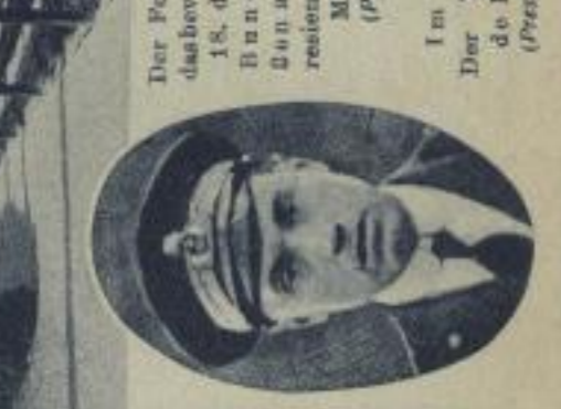
Im Oval: Der Weltflieger de Pinolo. (Pressefoto)