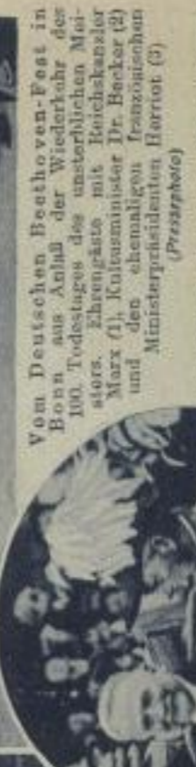
Vom Deutschen Beethoven-Fest in Bonn aus Anlaß der Wiederkehr des 100. Todestages des unsterblichen Meisters. Ehrengäste mit Reichskanzler Marx (1), Kultusminister Dr. Becker (2) und den ehemaligen französischen und Ministerpräsidenten Horriot (3). (Pressefoto)

Im Kreis: Präsident Domergue von Frankreich beim Besuch in London mit König Georg von England auf der Fahrt zum Buckingham-Palast. (D. P. Z.)