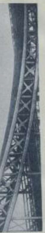
Linke: Die polnische Kriegsmarine im Kanal

Das von dem Poln... in Frankreich au... gebaute Kriegsge... schiff „Wielki W... Grawart“ wird von 2 franz. Hochsch... 2 brit. Nord-Oste... Kanal nach Polen geschleppt