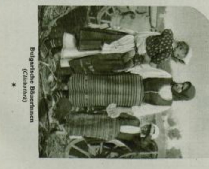
Bulgarische Bauern (Chisrad)