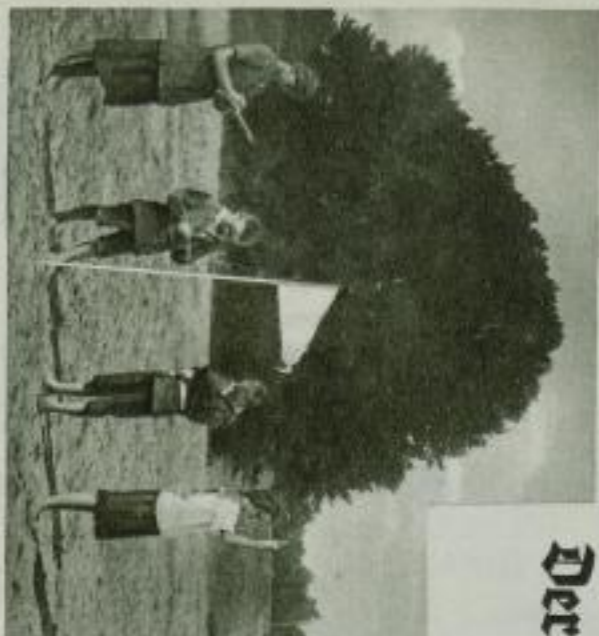
Bild links: Die Beobachtung der Windrichtung und die Bestimmung der Windstärke