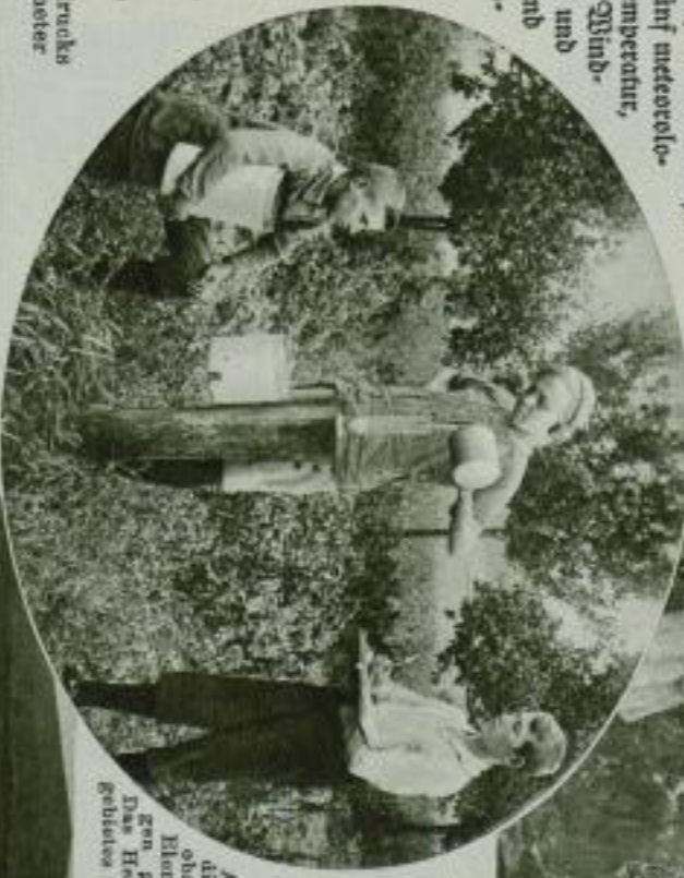
Unten Bild: An der Wettertafel werden die Zusammenhänge der verschiedenen witterkundlichen Momente und die Zusammenhänge zwischen einem Wetterbericht und dem Wetter beobachtet