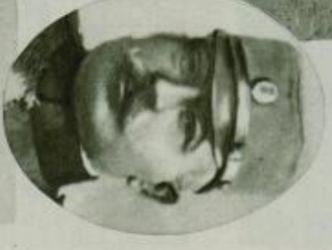
Rohtis (Oval): Der südslawische General Kowalschewitsch, der in Serbien von Kaiserin Elisabeth ermordet wurde, wurde in Sofia im Jahr 1911 in der Bulgarischen Hauptstadt begraben