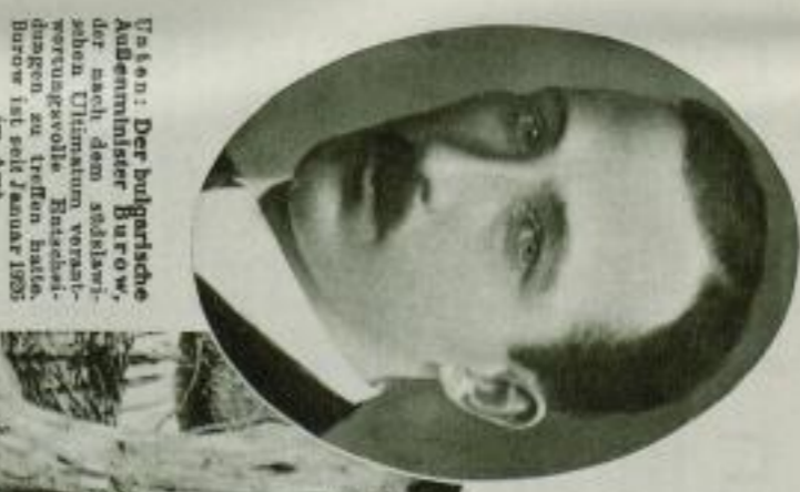
Der bulgarische Außenminister Barow, der nach dem russisch-serbischen Ultimatum vorläufigen Waffenstillstandes in Sofia im Januar 1913 im Amt