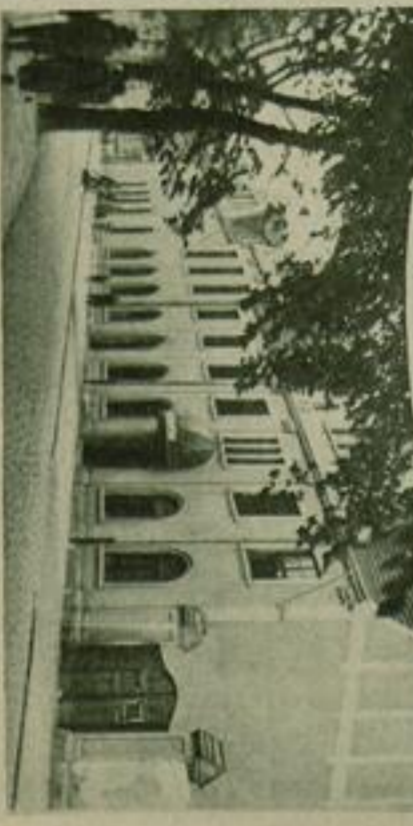
Das neue Studentenheim der Gewerbe-Hochschule in Göttingen in Arnim-Göttinger-Studentenheim ist das erste in seiner Art, das zur gleichen Zeit der Studentenenschaft gewidmet wurde