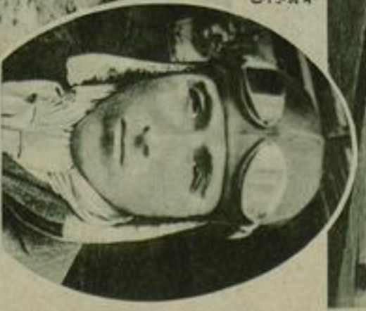
Rechts: Der französische Pilot Coates, der von Paris nach Buenos Aires flog. Der Ostflug von St. Louis (Wisconsin) nach Natal (Brasilien), 8300 km, wurde in 19 Stunden ohne Zwischen- landung durchgeföhrt