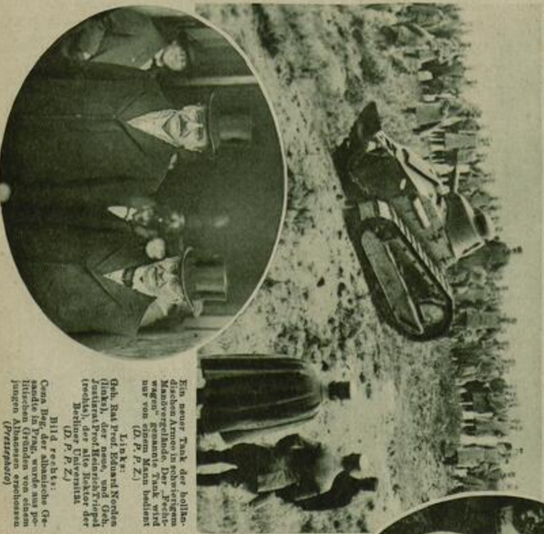
Ein neuer Tank der hollan- dischen Armee in belgischem Mandovogelnde. Der „Fech- wagen“ genannte Tank wird nur von einem Mann bedient