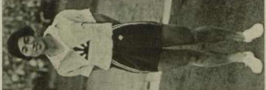
Frl. Hitomi, Japans erfolgreichste Sportlerin, ist an Brustdrüsenleiden erkrankt und ist in vielen Sportarten im gleicher Weise erfolgreich