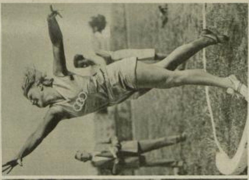
Deutsche Frauenmeisterschaften in Magdeburg Ellen Brannötter, die deutsche Fußballmeisterschaft, stellte mit 42,36 Meter einen neuen Weltrekord im Speerwerfen auf