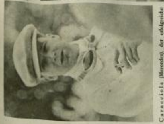
Carracciola (Mercedes) der erfolgreichste Rennfahrer, der das Rennen der großen Wagen über 100 Stundenkilometer als überlegter Sieger vor v. Morgen (Bogatti) und v. Braunhutisch (Mercedes) beendete