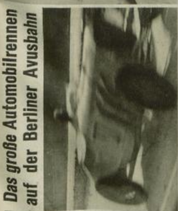
Das große Automobilrennen auf der Berliner Avusbahn