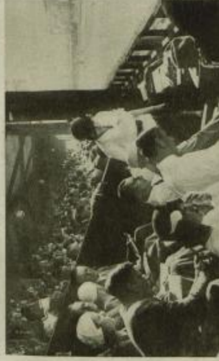
Bei dem schönen Sommerwetter gab es eine wahre Völkerwanderung. Hunderttausende säumten zu beiden Seiten die Rennstrecke