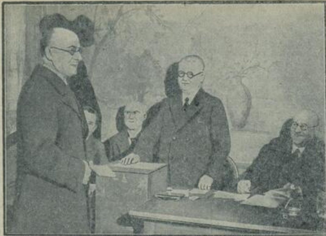
Bild links: Reichstagspräsident Dr. Brüning bei der Abgabe seines Stimmzettels Bild rechts: Dr. Goebbels, der Berliner Gauleiter der N.S.D.A.P., verläßt mit seiner Gattin nach der Wahl das Lokal.