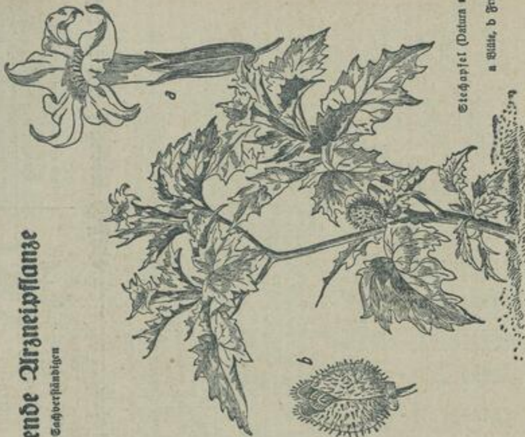
Stachafel ( Datura stramonium ) a Blüte, b Frucht

Der Boden soll etwas feuch, warm, durchlässig und in guter Kultur sein. Als Vorkultur wählt man am besten mit Stallmist gedüngte Äcker. Die Düngung muß reichlich sein. Man verwendet je Hektar (10000 qm) 200 bis 250 kg Stallmist, etwa 150 kg Superphosphat und 100 kg 40prozentiges Kaliumsulfat. Stallmist muß im Boden vorhanden sein. Später soll beim Pflanzensetzen noch mit 50 kg schwefelsaurem Ammoniak nachgedüngt werden. Das Pflanzgut wird am besten in kalten Winterkäufen herangezogen. Der Samen liegt drei bis vier Wochen in der Erde. Geplante wird bis vier Wochen in der Erde. Geplante wird bis vier Wochen in der Erde.