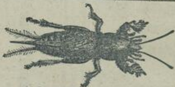
Die Maulwurfsgrille ( Gryllotalpa vulgaris )

Man sieht die Maulwurfsgrille selten: sie lebt in den Gängen unter der Erde. Das Graben legt in der Erde 10 cm tiefe Röhren von 2 bis 3 cm Durchmesser. Die Röhren sind mit einem feinen Sande überzogen, der die Röhren für die Gräber der Maulwurfsgrille; er hat die Aufgabe, die Röhren zu reinigen und zu vertiefen. Das Graben des Maulwurfsgrills hat die Aufgabe, die Röhren zu reinigen und zu vertiefen. Das Graben des Maulwurfsgrills hat die Aufgabe, die Röhren zu reinigen und zu vertiefen.