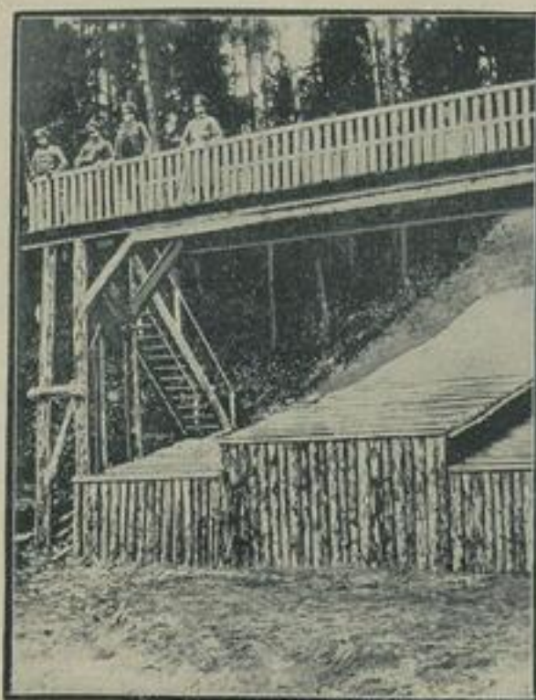
Die Reichswehr baut die größte Sprungschanze Ostpreußens. In Passenheim ist jetzt eine neue Skisprungschanze fertiggestellt worden, die im Januar eingeweiht werden soll und die größte Sprungschanze Ostpreußens ist. Diese Schanze ist von einem Reichswehrkommando aus Ortelsburg erbaut worden; sie hat vom Abstieg bis zum Aufsprung eine Länge von 45 Meter und besitzt als Neuerung eine 12 Meter lange Brücke über den Sprungfließ, von der aus 50 Zuschauer die Sprünge verfolgen können.