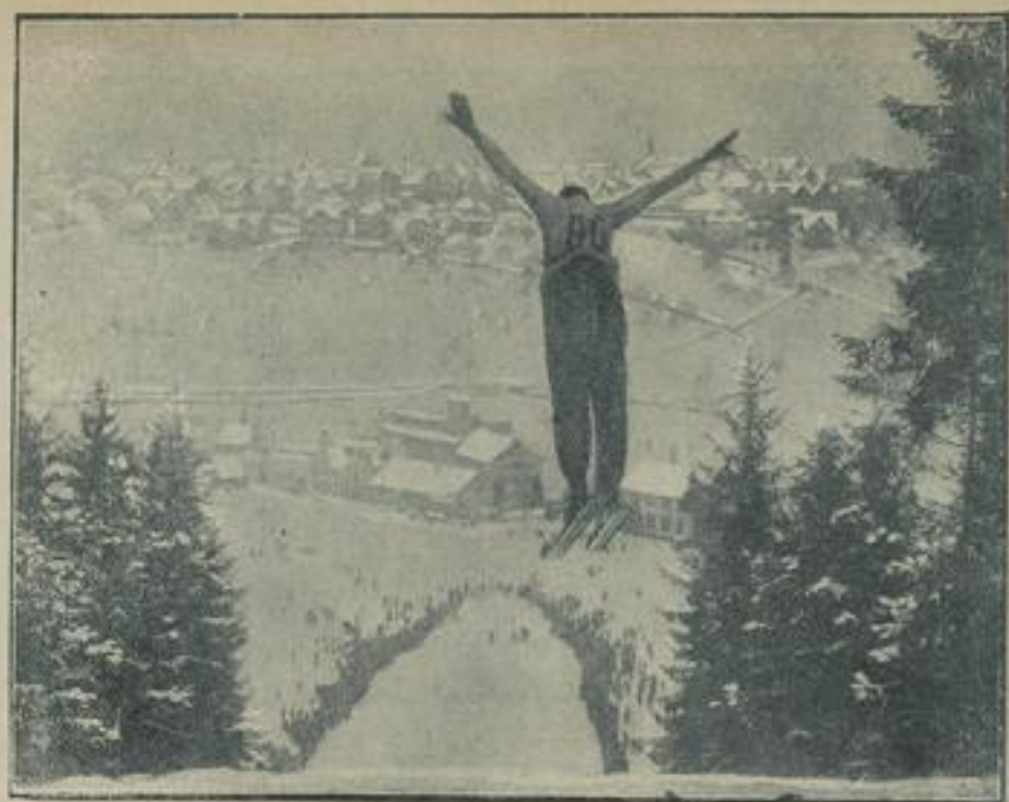
Hier wird die Deutsche Eismittelmeisterschaft ausgetragen. Die Deutsche Eismittelmeisterschaft wird in diesem Jahre vom 17. bis 20. Februar in Freudenstadt-Baiersbrunn durchgeführt. Unser Bild berichtet vom vorjährigen Sprunglauf an der Schwarzwaldschanze in Freudenstadt, an der in diesem Jahre der Jungmannsprung ausgetragen wird.