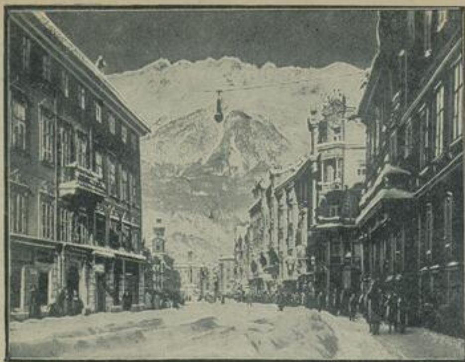
Hier werden die ISE-Wettlämpfe ausgetragen. Die Hauptstadt von Tirol, Innsbruck, ist der Schauplatz der ISE-Wettlämpfe — der ersten Eismittelmeisterschaft — im Februar, an denen sich die besten Eismittelmeister aus aller Welt beteiligen werden.