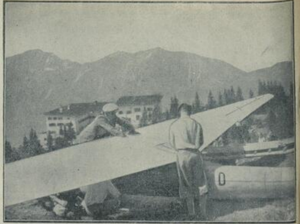
Der erste hochalpine Segelflug geglückt. Unser Bild berichtet von dem ersten hochalpinen Segelflug, der mit dem Hochleistungsflugzeug „Hauptmann Göring“ von dem über 1600 Meter hohen Predigstuhl b. Bad Reichenhall durchgeführt wurde: die Maschine kurz vor dem Fluge, der in Bad Reichenhall glatt beendet wurde.