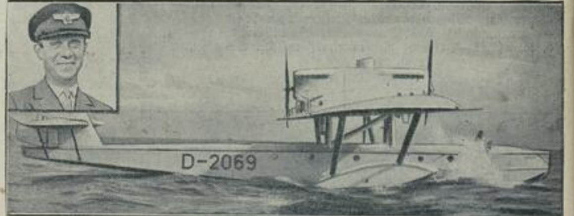
Der erste Flug Westafrika-Brasilien mit Hilfe der schwimmenden Fluginsel bewältigt. Im Rahmen der von der Deutschen Luft-Hansa unternommenen praktischen Versuche für den Betrieb einer Luftpostverbindung nach Südamerika hat das Dornierwal-Flugboot D 2069 „Konsum“ zum ersten Mal den Südatlantischen Pazur (westafrikanische Küste) und Natal (Brasilien)