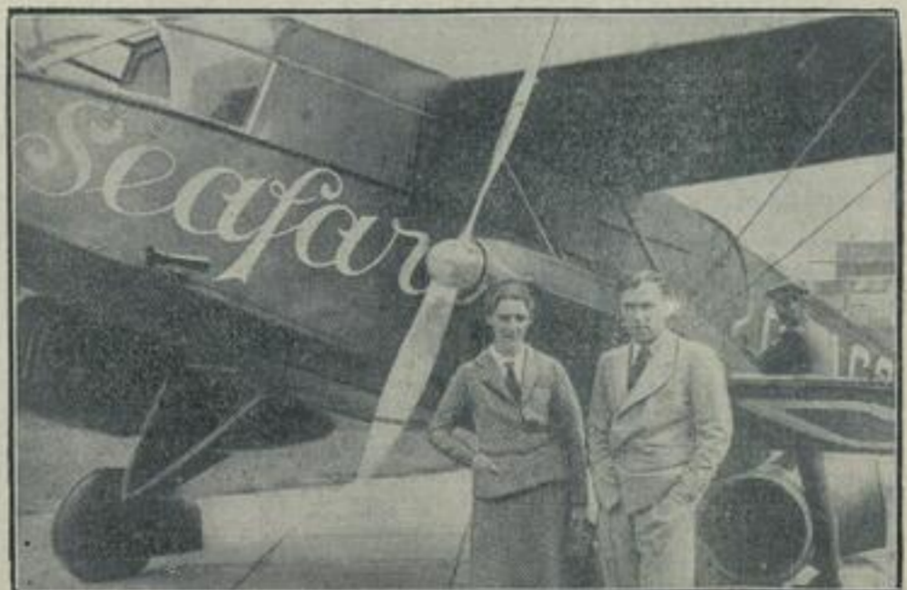
Vor einem neuen Rekordflug des Fliegerehepaares Mollison-Johnson. Das bekannte englische Fliegerehepaar Mollison-Amy Johnson steigt in den nächsten Tagen mit diesem neuen Flugzeug, „Seefar“, von London zu einem neuen Rekordflug auf: sie wollen zunächst den Ozean ohne Zwischenlandung