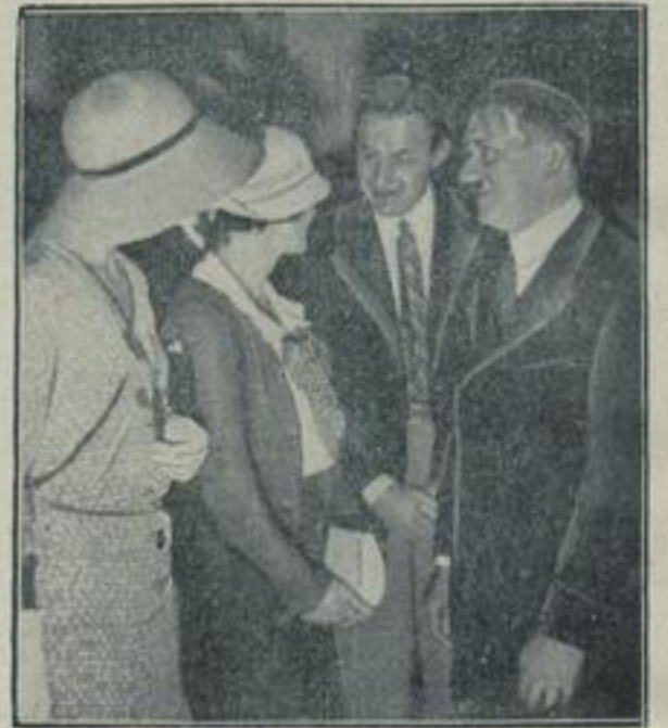
Die englischen Sportflieger beim Reichsanzler. Die englischen Sportflieger, die gegenwärtig auf ihrem Rundflug durch Deutschland in der Reichshauptstadt weilen, wurden auch vom Reichsanzler Adolf Fittler in Audienz empfangen, bei der unser Photograph dieses Bild knipste.