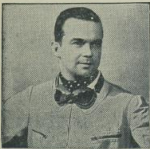
„Europameister“ Caracciola. Der erfolgreichste Automobilrennfahrer des Jahres, der Mercedes-Benz-Fahrer Rudolf Caracciola, wurde auf der Pariser Tagung der Internationalen Vereinigung der Automobilklubs mit dem Titel „Europameister“ ausgezeichnet und erhielt die goldene Medaille der Vereinigung. (Weltbild — M.)