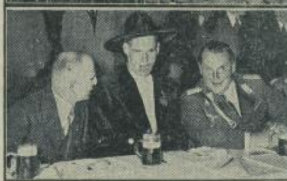
Das große Nichtfest am neuen Reichsluftfahrtministerium. Die 5000 Mann starke Belegschaft beim Neubau des Reichsluftfahrtministeriums in Berlin feierte gemeinsam mit dem Reichsminister der Luftfahrt, General Göring, das Nichtfest. Unser Bild oben berichtet vom Abschluß des Nichtfestes: der 20 Zentner schwere Nichtstranz wird in die Höhe gezogen — unten: der Festschmaus der 5000 im Speisesaal. Von links der Bauleiter Prof. Dr. Sogebiel, ein Bauarbeiter und Ministerpräsident Reichsminister der Luftfahrt, General Göring.