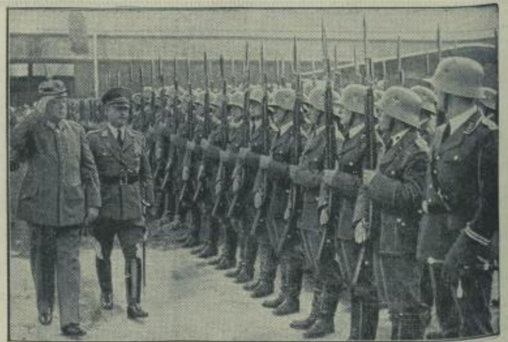
Einweihungsfeier bei der Deutschen Versuchsanstalt f. Luftfahrt. Die Deutsche Versuchsanstalt für Luftfahrt veranstaltete eine Feier zu Ehren des Oberst a. D. Thomsen, ehemals Chefes des Generalstabes der Luftstreitkräfte, und des verstorbenen Oberstleutnants a. D. Siegert, ehemals Inspektors der Fliegertruppen, in den Arbeitsräumen der Anstalt in Berlin-Adlershof. Die Feier war gleichzeitig mit der Übernahme neuer Bauleitern und der Taufe von zwei Verkehrsflugzeugen der Deutschen Luftwaffe verbunden: Der blinde Oberst Thomsen schreitet, geführt von Generalleutnant Milch, die Front der angezogenen Fliegertruppen ab.