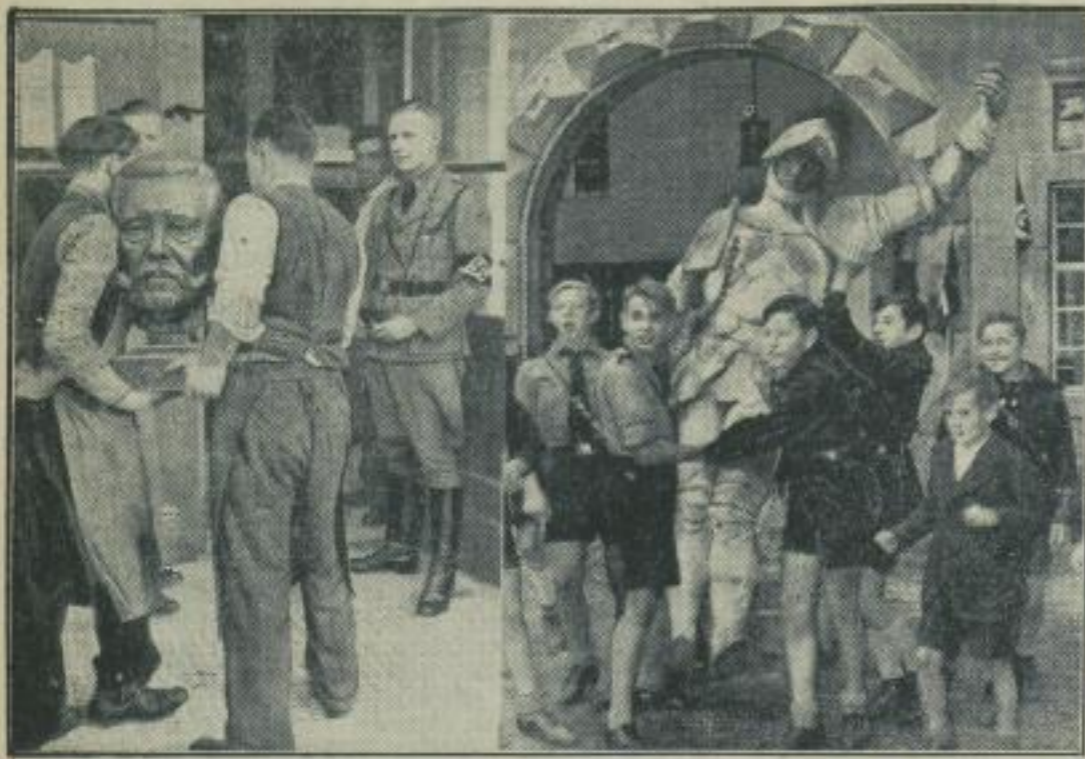
Erstes und Weiteres vom Jugendherbergswerk. Zum Jahrestag der Übernahme der Deutschen Jugendherbergen durch die Hitler-Jugend werden am kommenden Sonntag 27 neue Jugendherbergen in Deutschland geweiht. Die größte Herberge unserer wandernden Jugend wird die Paul-von-Hindenburg-Jugendherberge in Hannover sein; das Bild links

berichtet von dem Transport der Büste Hindenburgs in die Herberge, wo sie im Vorraum aufgestellt werden soll. Rechts ein lustiger „Zwischenfall“ bei der Einrichtung der Jugendherberge in der alten Burg Storfow in der Mark; der letzte Ritter von Storfow muß unwillig die Burg verlassen.