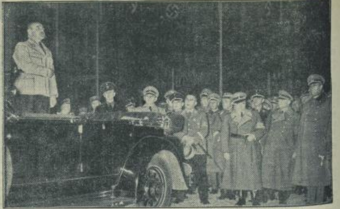
Die 300 ältesten Politischen Leiter in Weimar. Thüringen steht in diesen Tagen im Zeichen des Besuches der 300 ältesten Politischen Leiter der NSDAP, die zu einer Rundfahrt durch das Land in Weimar eingetroffen sind. Die Stadt bereite die alten Garde des Führers einen überaus herzlichem Empfang; im Schloßhof wurden die Gäste von Gauleiter Reichshattbalter Sausel willkommen geheißen. In der Mitte Reichsorganisationsleiter Dr. Ley.

berichtet von dem Transport der Büste Hindenburgs in die Herberge, wo sie im Vorraum aufgestellt werden soll. Rechts ein lustiger „Zwischenfall“ bei der Einrichtung der Jugendherberge in der alten Burg Storfow in der Mark; der letzte Ritter von Storfow muß unwillig die Burg verlassen.