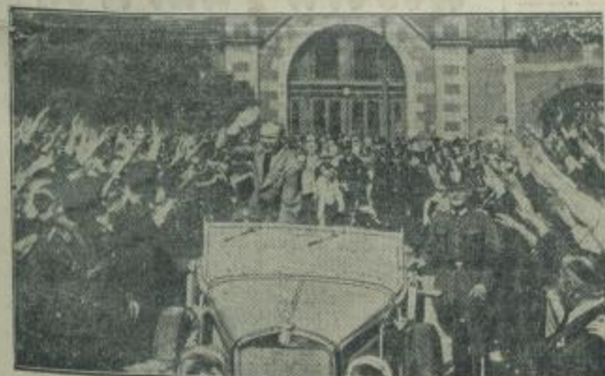
Danzig umjubelt Greiser. Senatspräsident Greiser wurde bei seiner Rückkehr aus Genf von der Danziger Bevölkerung jubelnd empfangen — ein Zeichen für die einmütige Zustimmung, die Greisers Rede vor dem Völkerverbund in Danzig gefunden hat. (Weltbild — M.)

anzug wurde eine einfarbige graue Bekleidung gewählt. Auf der linken Brustseite tragen unsere Olympia-Teilnehmer des Reichsbundabzeichen. Unser Bild zeigt von links: den weißen Trainingsanzug, den grauen Tagesanzug, den weißen Festanzug und den braunen Trainingsanzug der deutschen Olympia-Teilnehmer. (Weltbild — M.)