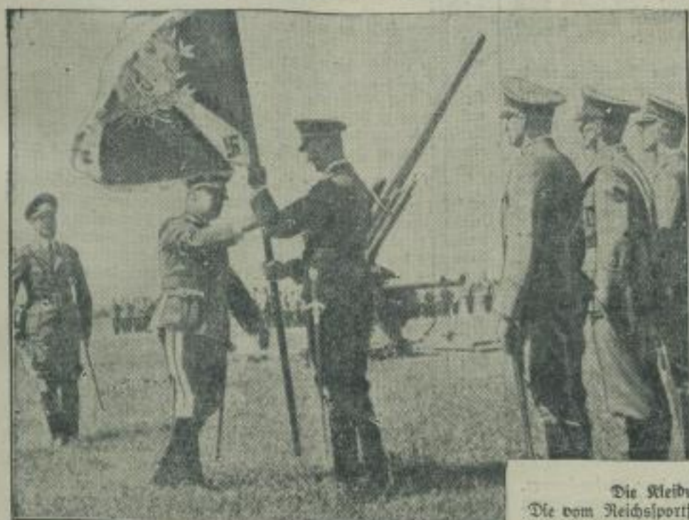
Ein Ehrentag für die ostpreussische Luftwaffe. Auf dem Flugplatz von Neubausen fand die feierliche Übergabe von mehreren Häfen an verschiedene Einheiten der Luftwaffe durch den General der Flieger Staatssekretär Milch (links, grüßend) statt.