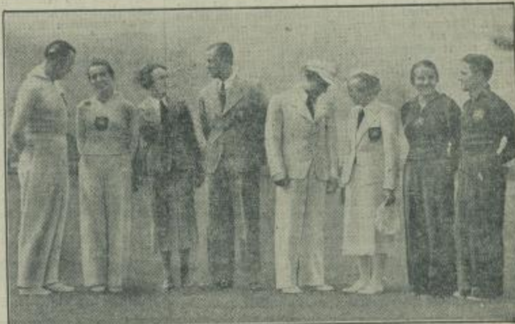
Die Kleidung unserer Olympia-Kämpfer. Die vom Reichsportführer bestimmte Bekleidung der deutschen Olympia-Mannschaft ist schlicht und doch festlich; beim Einzug der Nationen trägt die deutsche Mannschaft einen weißen Anzug, weiße Mütze, weiße Schuhe und schwarze Krawatte. Für Frauen ist eine entsprechende Tracht vorgesehn. Als Tages-

anzug wurde eine einfarbige graue Bekleidung gewählt. Auf der linken Brustseite tragen unsere Olympia-Teilnehmer des Reichsbundabzeichen. Unser Bild zeigt von links: den weißen Trainingsanzug, den grauen Tagesanzug, den weißen Festanzug und den braunen Trainingsanzug der deutschen Olympia-Teilnehmer.