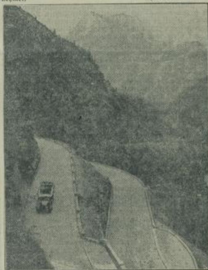
Die Reichsautobahn erschließt die schönsten Strecken der Alpen. Soeben wurden zwei weitere Teilstrecken der Alpenstraße von Unterjochenberg nach Schwarzbachwacht und von Schneitzteufel nach Wegscheid bei Mautsäckel dem Verkehr übergeben. Die Alpenstraße erschließt eine der schönsten Landschaften Deutschlands dem großen Verkehr und ist von hervorragender Bedeutung für die Entwicklung des südbayerischen Fremdenverkehrs. Bild rechts: