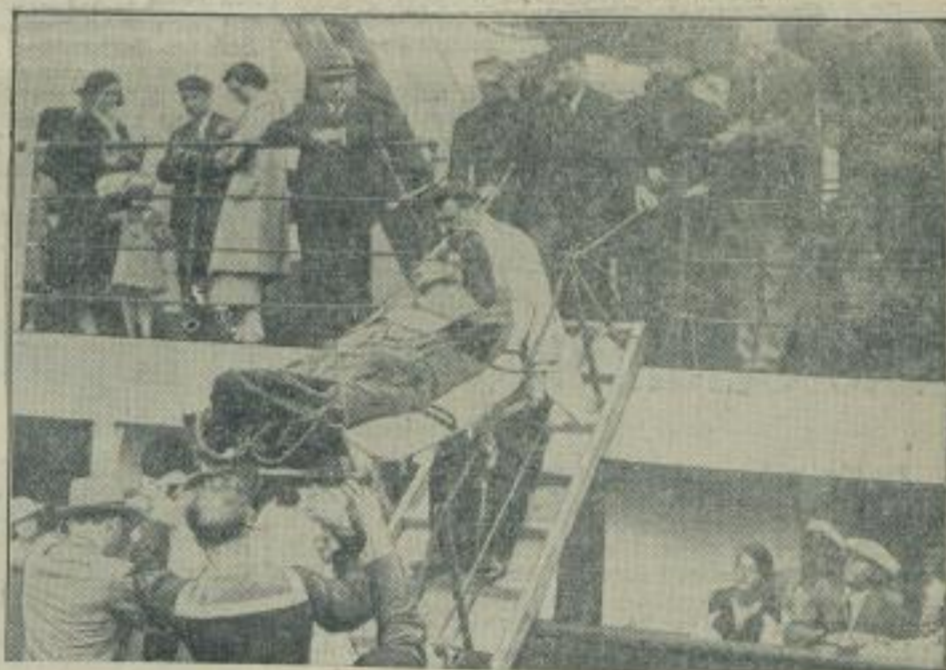
Deutsche Opfer des spanischen Bürgerkrieges flüchten nach Frankreich. Mit dem deutschen Dampfer „Dehona“ kamen in dem fran-

zösischen Hafen von Bayonne deutsche Flüchtlinge aus Spanien an. Hier leben wir einen bei den Anruden in Spanien verletzten Deutschen beim Wtransport vom Schiff.