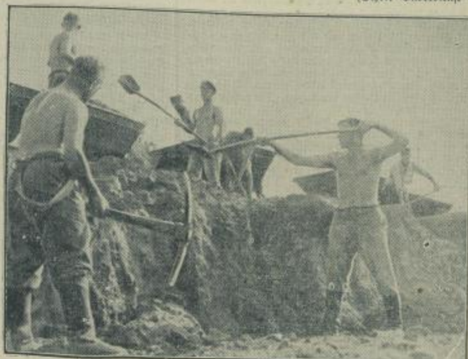
Der Reichsarbeitsdienst — das Werk des Führers. Als Lösung des Arbeitslosenproblems der Jugend und Wegweiser zu einem neuen Arbeitsethos in Abfolge von der materia-

lischen Auffassung der Arbeit (auf der Führer Adolf Hitler den Reichsarbeitsdienst, der alle jugendlichen schaffenden Deutschen erfasst.