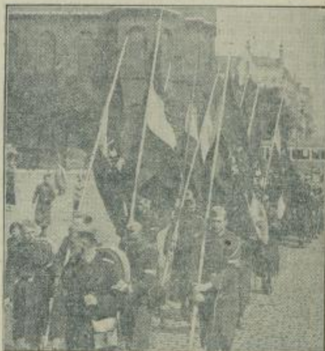
Der Sturmorch der deutschen Jugend nach Nürnberg. In allen deutschen Gauen brechen in diesen Tagen die Ehrenformationen der HJ-Gebiete zum Marsch in die Stadt des Reichsparteitages auf. Die 50 Hiltlerjungen der zehn Berliner Banne sind jetzt abmarschiert, um am Tage der feierlichen Eröffnung des Reichsparteitages in Nürnberg einzutreffen.