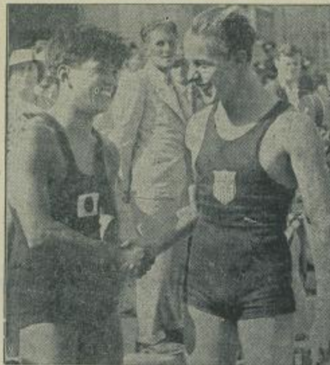
Reitdes beglückwünscht der Unterlegene den Olympiasieger. Im olympischen Kunstspringen der Männer konnte der amerikanische Meister Richard Vogner die Goldmedaille gewinnen. Nach der Bekanntgabe der Wertungen war der Japaner Shibahara, der den vierten Platz bekam, der erste, der den Olympiameister zu seinem schönen Erfolg beglückwünschte.