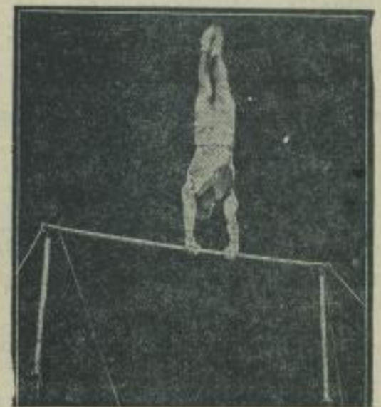
Konrad Freys Medaillenserie. Der Krenschacher Reiterturner gewann im Weltkampf der Turner für Deutschland eine Reihe von Medaillen. — Konrad Frey am Red.