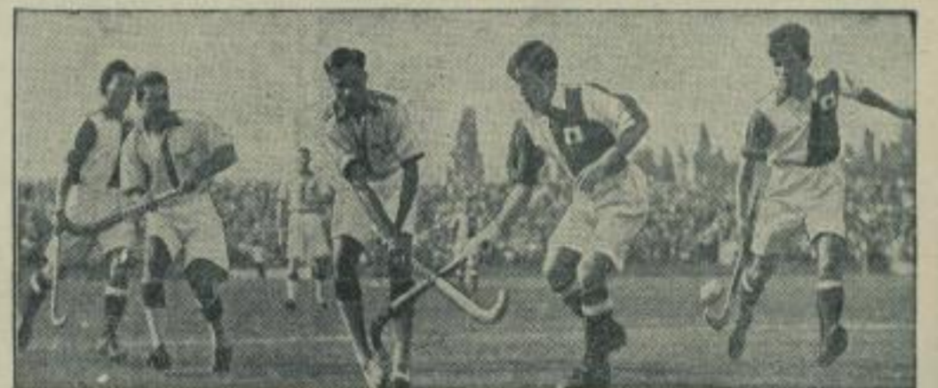
Indiens Meisterpieler schlagen Japan sicher. Auf dem Hockeystadion des Reichssportfeldes schlugen die indischen Hockeyweltmeister ihre japanischen Gegner überlegen mit 9:0 und wurden damit Gruppensieger. Hier ist Indiens Meisterpieler Dhan Chand am Schuß.