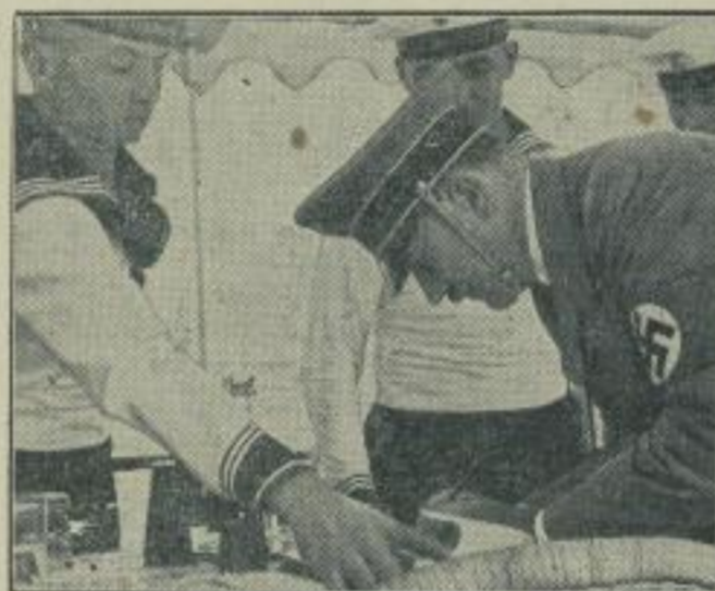
Der Führer gibt Autogramme. Ein kleines Bild von dem großen olympischen Geschehen in Aiel. Der Führer, der den Bootlämpfen der Segler beivoohnte, gab Autogramme.