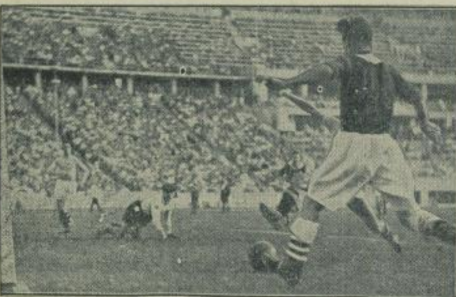
Wieder eine olympische Fußballüberrasschung: Italien schaltete Norwegen aus. Das erste Spiel der Vorkampfrunde im olympischen Fußballturnier Italien gegen Norwegen endete nach Verlängerung mit