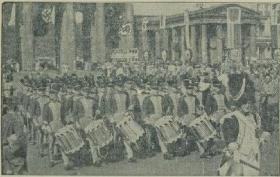
Baller Trommler ziehen durchs Brandenburger Tor. Ein malerisches Bild boten die Baller Trommler bei ihrem Zug durchs Brandenburger Tor unter den Linden entlang zum Ehrenmal, wo eine Kranzniederlegung erfolgte.