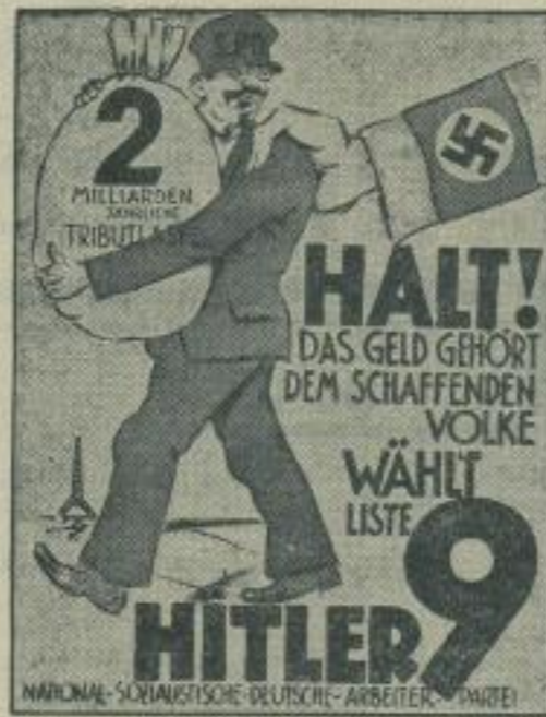
Zehn Jahre Gau Berlin der NSDAP. Zum zehnjährigen Bestehen des Gau Berlin der NSDAP findet im Berliner Rathaus eine Ausstellung „Zehn Jahre Kampf um Berlin“ statt, auf der auch dieses Wahlplakat aus der Kampfszeit zu sehen ist.