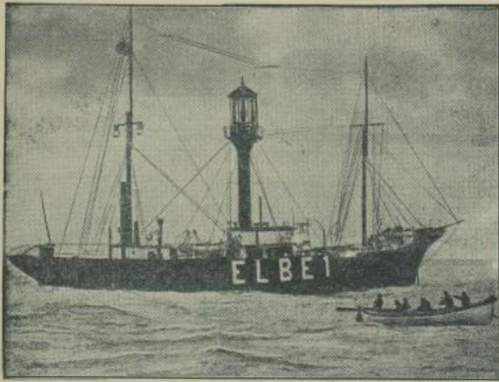
Feuerschiff „Elbei“, das mit seiner kapieren Besatzung im Orkan gekentert ist.