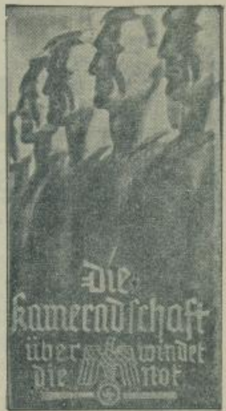
Die Titelplatte des WFB für November 1936. (Wagenborg - M.)