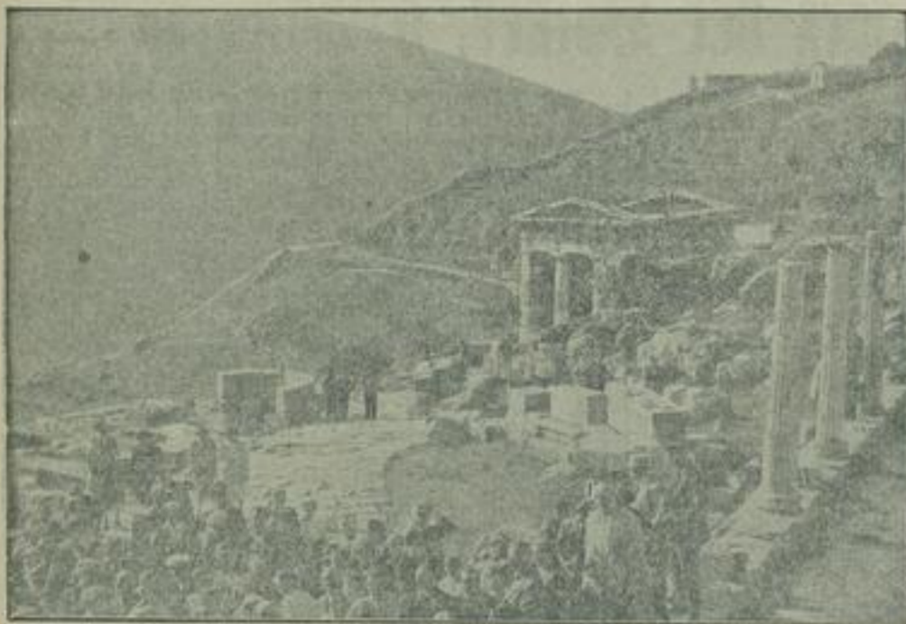
Zum 1. Male hat die NS-Gemeinschaft „Kraft durch Freude“ eine Schiffsreise nach Jugoslawien und Griechenland durchgeführt, bei der den deutschen Arbeiter die Etappen des klassischen Altertums gezeigt wurden. — Unter fachkundiger Führung werden die Anlagen in Delphi besichtigt.