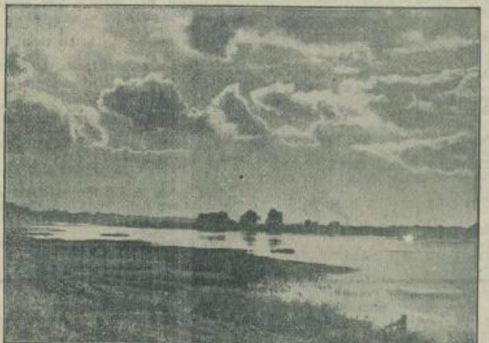
Reichvolles, liebes deutsches Land an der Memel. Weisthin schweift unser Blick über das nunmehr nach zwanzig langen Jahren schmerzlicher Trennung wieder ins Reich heim-