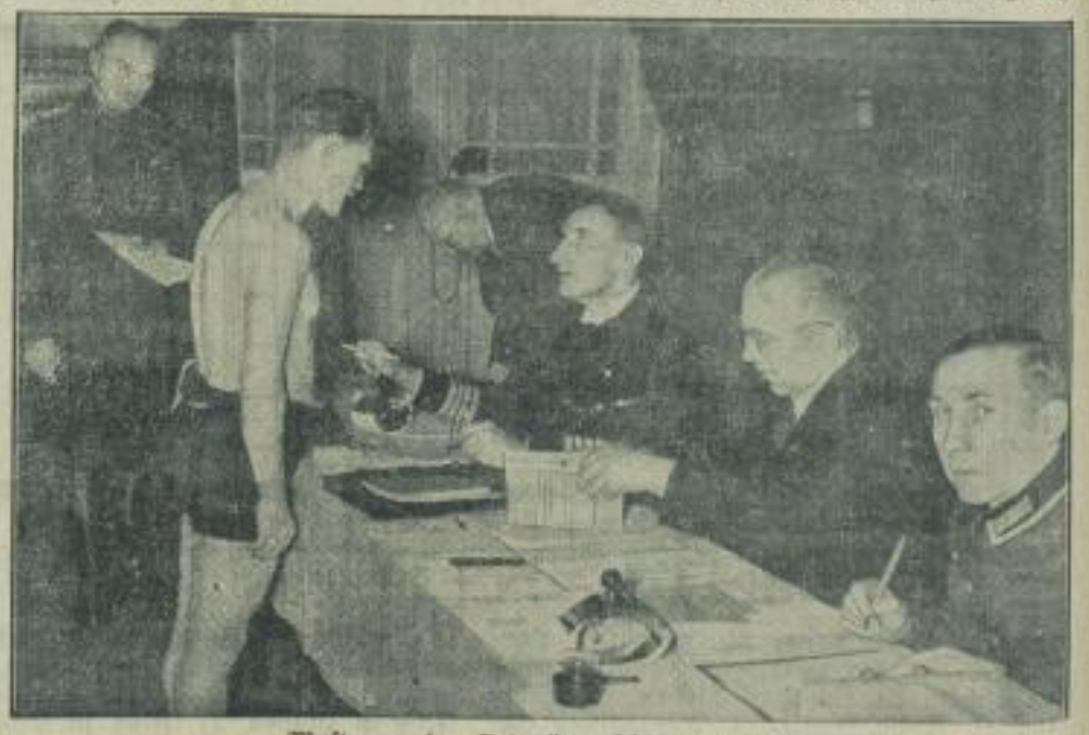
Musterung der Jahrgänge 1906 und 1907. — Ein Bild von der Musterung bei einem Berliner Wehrbezirkskommando.