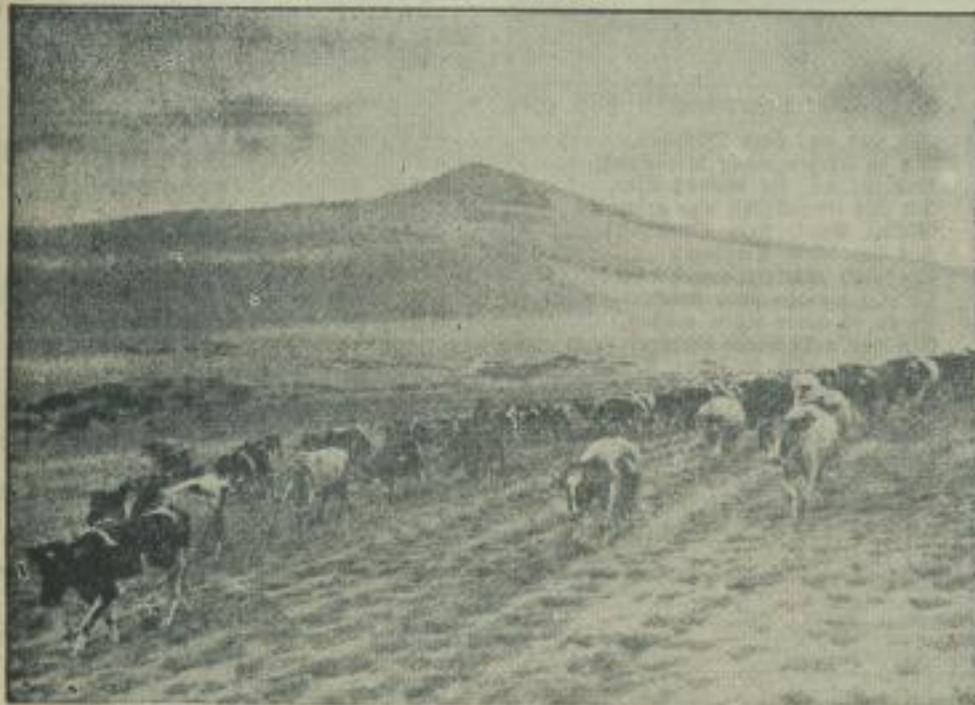
Schönes, freies Land an der Memel. Dr. Krause-Kreuzingen-Wagenborg-M.)