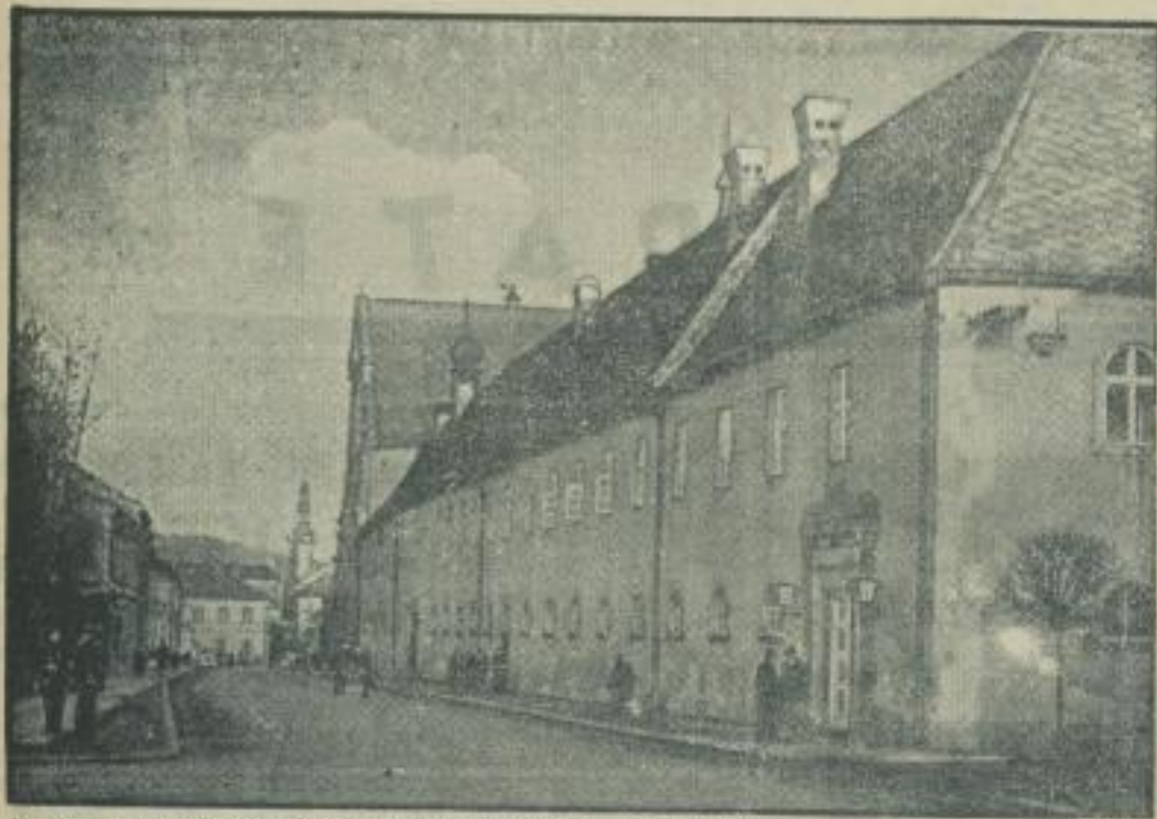
Zu den entsprechenden Reichsautobahnstationen, die überall im Großdeutschen Reich an den Straßen Adolf Hitlers entstehen, ist jetzt als jüngste die Reichsautobahnstation in Mährisch-Trübau getreten, die unser Bild zeigt.