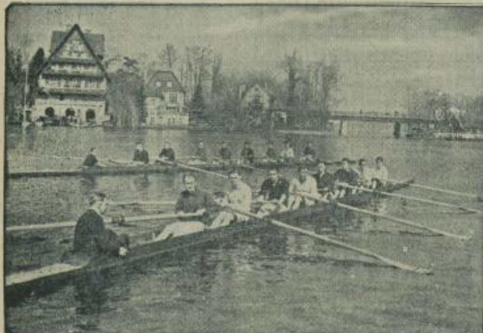
Das neue Ruderjahr hat begonnen. Reichssportführer von Eschammer und Wien eröffnete von Leitmeritz (Sudetenland) aus über den Rundfunk mit einer Rede das neue Ruderjahr. Im ganzen Reich waren die Ru-