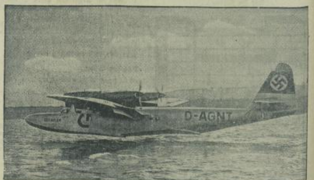
„Do. W.“ auf dem Rüggeensee. Die Berliner konnten das erste Transatlantik-Passagier-Flugboot der Deutschen Luft Hansa auf dem Rüggeensee bewundern. Der „Seeadler“ wird in wenigen Wochen in den Südatlantikdienst der Luft Hansa gestellt und nimmt dabei zum erstenmal Fluggäste mit.