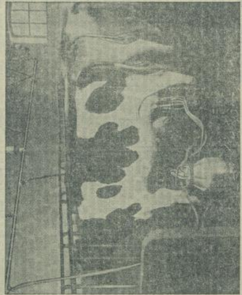
Die Melkmaschine arbeitet

Besonders unannehmlich macht sich heute bei uns das Problem der Milchleistung im Milchviehstall geltend. Es gibt zwar Melkmaschinen, die den Melkern die Arbeit erleichtern, aber diese sind zum Teil noch sehr unvollkommen. Die Melkmaschine soll die Milchleistung fördern und die Arbeit erleichtern. Sie soll die Milchleistung fördern und die Arbeit erleichtern. Sie soll die Milchleistung fördern und die Arbeit erleichtern.