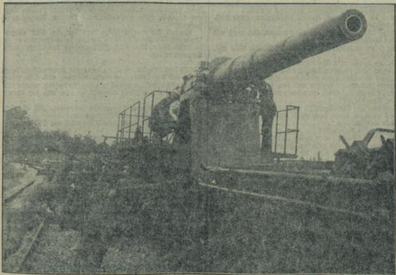
Bei der schwersten Artillerie unserer Wehrmacht. Zu den schwersten Geschützen unserer Wehrmacht gehören die Eisenbahngeschütze, die schnell von einer Front zur anderen verschoben werden können. Wir bringen hier zwei Aufnahmen

Im Hochtal der Wimbach bei Berchtesgaden fand eine große Übung des Gebirgsjägerregiments 100 statt, bei dem Truppe und Führung den vollen Einsatz aller technischen Kampfmittel des modernen Gebirgskrieges erproben konnten. Die Tragtiere konnten oftmals nicht eingesetzt werden, und dann mußte jeder Mann 40 Kilogramm Last auf dem Buckel in steilem Anstieg tragen. — Die Tragtiere beim Gebirgsmarsch.