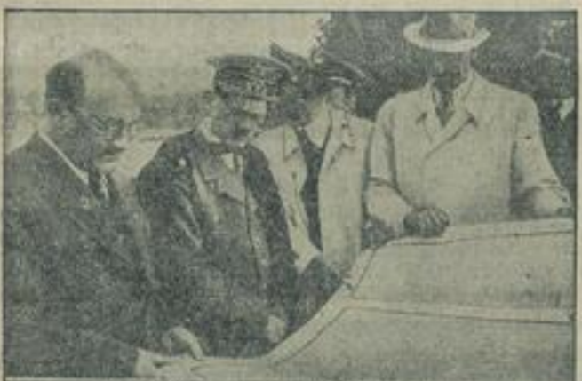
Der Führer auf dem Parteitagsgelände. Der Führer wollte auf dem Parteitagsgelände in Nürnberg und ließ sich über den Stand der Vorbereitungen für den „Parteitag des Friedens“ unterrichten.

Für die Feldparade sind in einer Ausdehnung von 400 Meter Länge 40 bis hintereinander stehende Stützlinien für 40 000 Personen fertiggestellt. Die Ehrentribüne wird 2000 Gäste der Reichsregierung aufnehmen. Alle übrigen Teilnehmer können von bequemen Sitzplätzen aus der Feldparade beobachten.