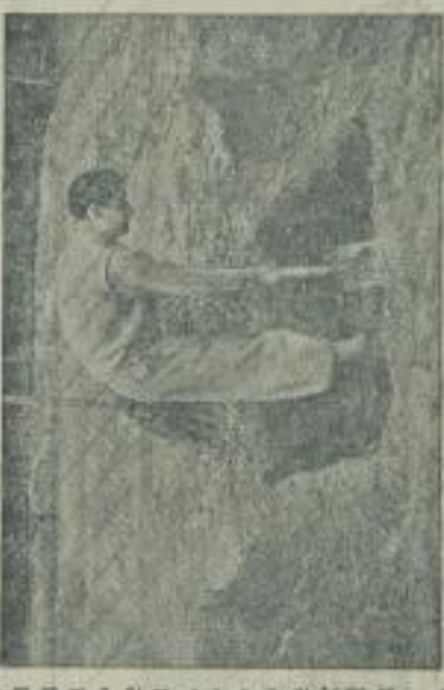
Abb. 2. In die Grube werden Mist, wie Düngemittel, gegeben

Die schädlichen Bodeninsekten sind eine große Gefahr für die Landwirtschaft. Durch die Verwendung von Sanggruben kann die Bekämpfung dieser Insekten erleichtert werden. Dies kann durch die Zugabe von bestimmten Substanzen erreicht werden.