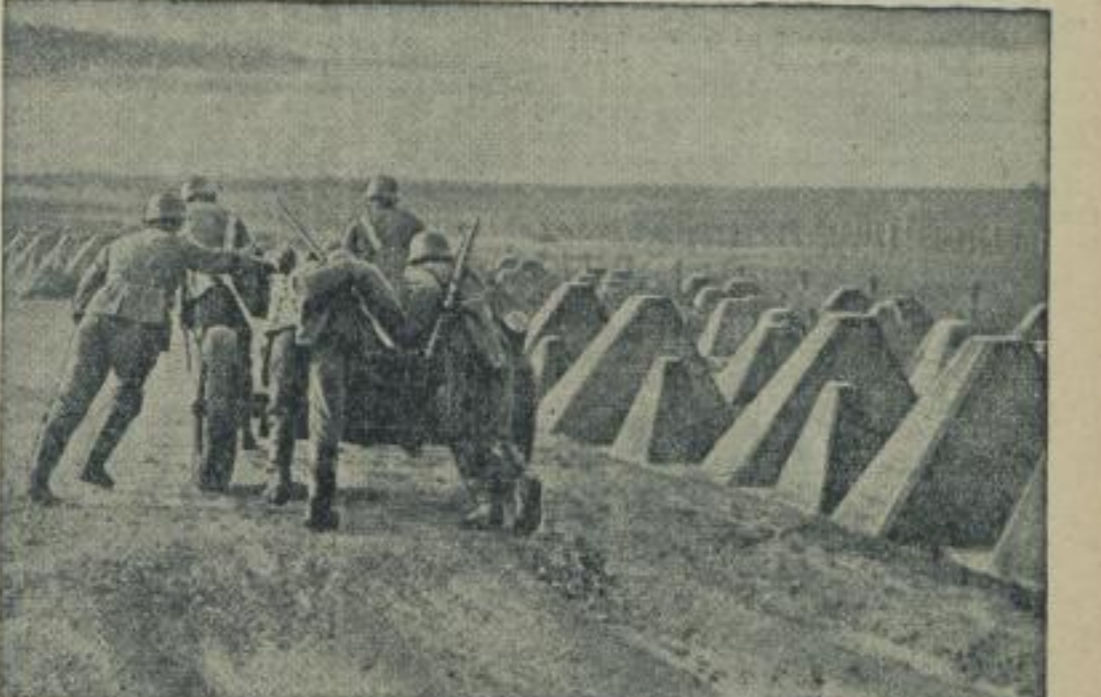
Panzerhäusern ergründeten an der Westfront.