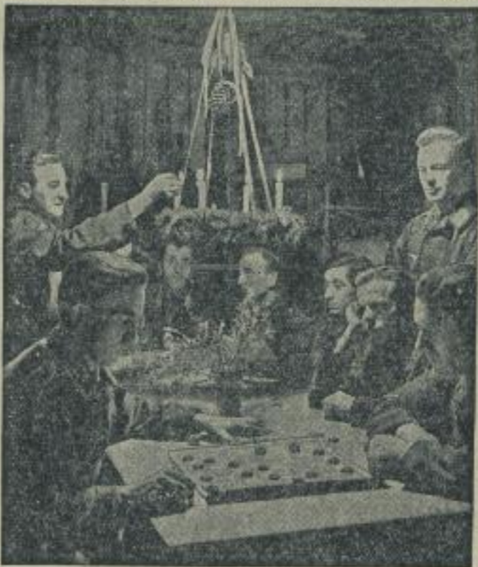
Adventsabend in einer Hauerunterkunft.