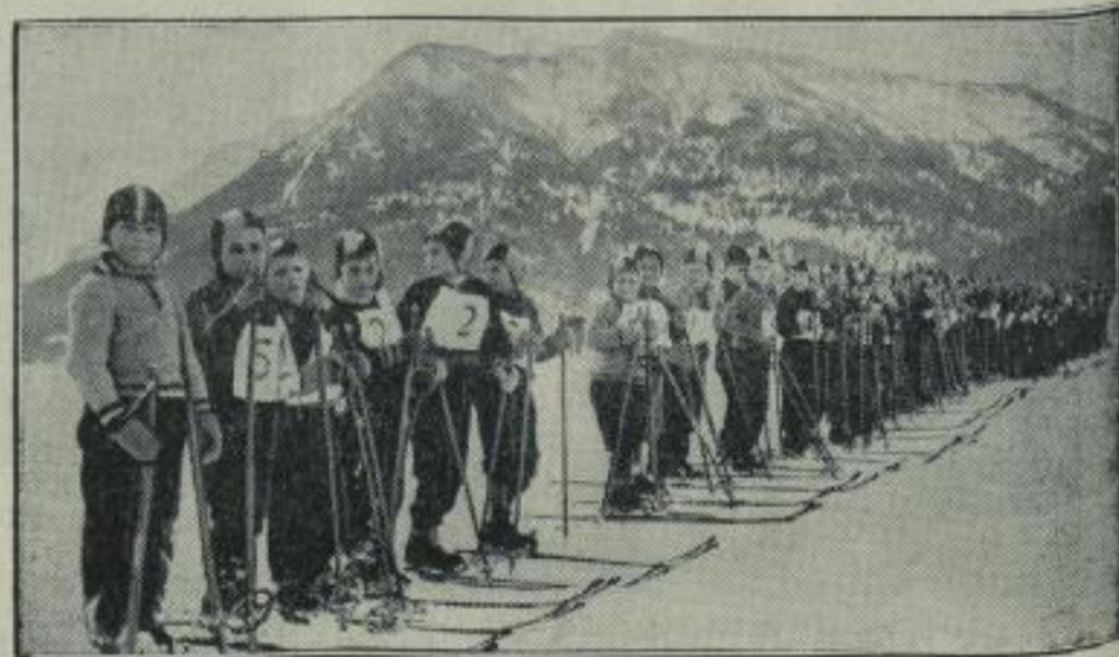
Skilanglauf als Schulfach.

Die große Bergprüfungsfahrt bei der vom NERK und D.-M. gemeinsam veranstalteten Winterprüfung in Oberstaufen stellte an die Teilnehmer große Anforderungen. Unsere Aufnahme zeigt einen Konkurrenten bei diesem Wettbewerb.