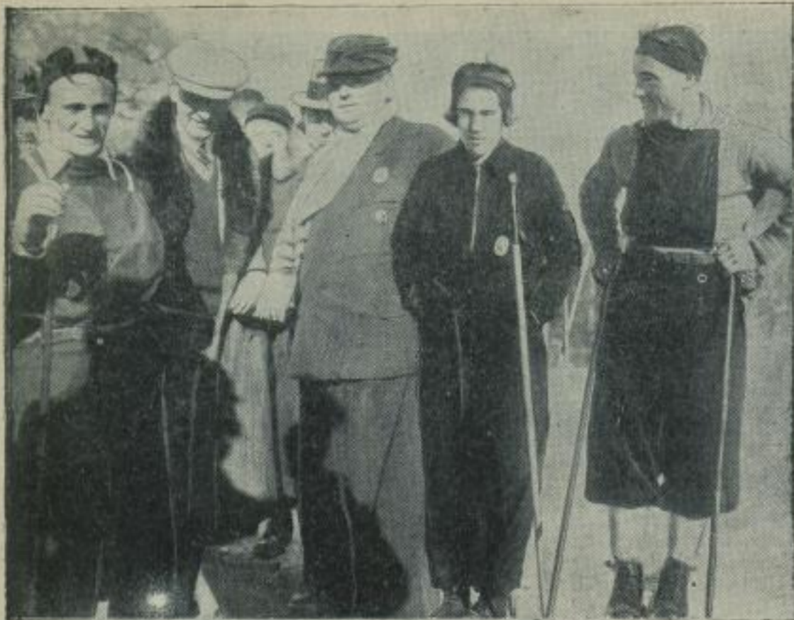
Neue Bilder von den Deutschen Skimeisterschaften.