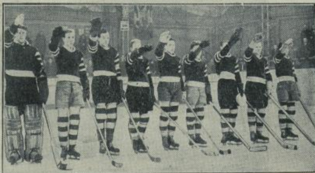
Deutschland wieder Europameister im Eishockey.

Ein hübsches Bildchen von einer Läufergruppe bei den Deutschen Skimeisterschaften in Berchtesgaden auf der Rennstrecke im tiefverschneiten winterlichen Wald.