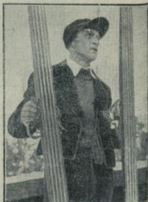
Deutscher Ski-Meister 1934.

Ein Bild auf die Trümmer des von dem starken Sturm umgelegten Funtturmes auf dem Hamburger Flugplatz Fuhlsbüttel.