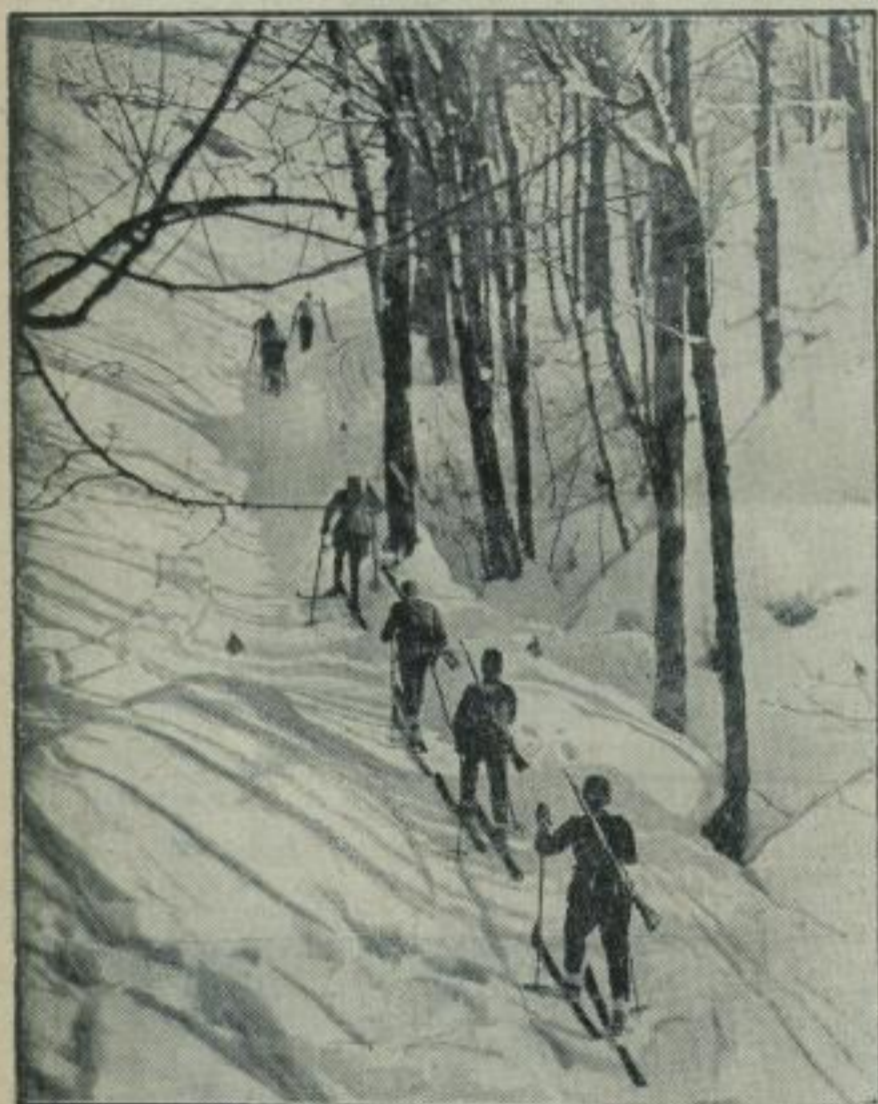
Deutsche Skimeisterschaften im verschneiten Winterwald.

Im Rahmen der Deutschen Ski-Meisterschaften kam jetzt in Berchtesgaden die Staffel-Meisterschaft zum Austrag, aus der wir hier ein hübsches Bild wiedergeben: Wechsel der siegreichen Bayern-Staffel.