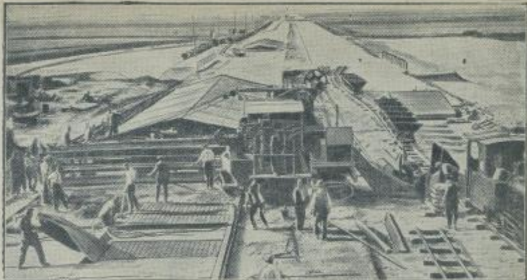
Der Bau der Reichsautobahnen schreitet voran.

gebiet im Jahre 1923 in einer Nacht gestürzt worden. Die Standbilder lagen Jahre hindurch hinter Stacheldraht auf einem Feuerwehrtuch, wo sie auch unser Bild zeigt. Jetzt sind sie auf Anordnung des Oberbürgermeisters vergraben worden.