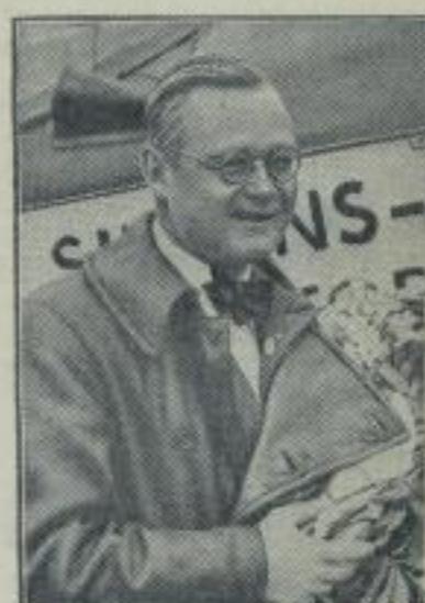
Afrillesieger Schwabe erhält den Hindenburg-Pokal.

Bei der ersten Etappe der deutsch-polnischen Radfahrerin Berlin-Warschau führten die Deutschen Hauswald-Ebennich vor Voerbeck-Hagen und Voerbeck-Frankfurt.