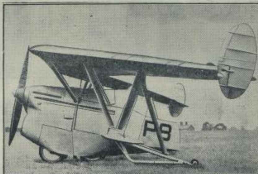
Ein französisches Militärflugzeug.

Die Arbeiten an den Haupttribünen und am Gefallenen-Denkmal im Luftpolzbain in Nürnberg, wo die großen Aufmärsche beim Reichsparteitag stattfinden, sind jetzt beendet. Unser Bild gibt einen Ausblick von der Haupttribüne zum Gefallenen-Denkmal im Luftpolzbain.