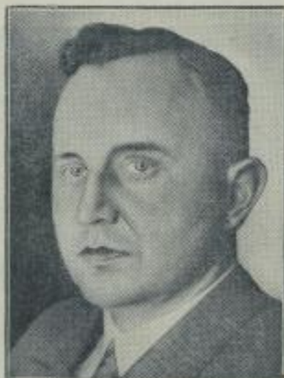
Reinberg zum Stellvertreter Darrés ernannt.

Wie unser Bild zeigt, ist auf einem Teil der Reichsautobahn bereits mit den Betonierungsarbeiten begonnen worden; von Kilometer Null bis Kilometer 21 auf der Strecke München-Vollstirchen geht die Bahn ihrer Fertigstellung entgegen. Die dortigen Abdeckungen auf der linken Fahrbahn verhindern das zu rasche Austrocknen der fertigen Betonbede.