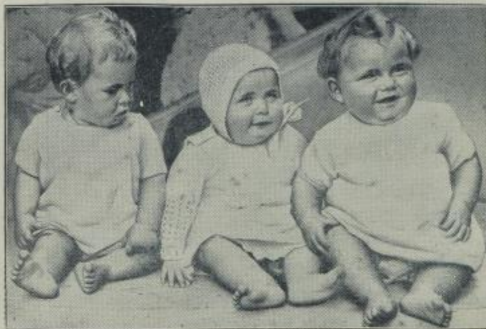
Das schönste Kinderlächeln wird gesucht.

Nach der Ermordung des österreichischen Bundeskanzlers und den damit zusammenhängenden Unruhen in Oesterreich hatte Italien bekanntlich größere Truppenmassen an der italienisch-österreichischen Grenze zusammengezogen. Jetzt sind diese Formationen wieder abgezogen; unser Bild von der Strecke zwischen Brenner u. Meran berichtet vom Rückmarsch der Truppen.