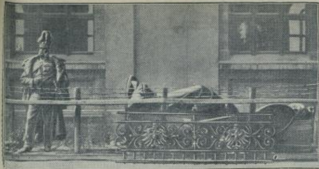
Deutsche Denkmäler werden in Memel vergraben.

Die Litauer haben vor einigen Nächten den Sockel zum Kaiser-Wilhelm-Denkmal in Memel herausgerissen. Dieses Denkmal ist bekanntlich ebenso wie das Porzellan-Denkmal vor dem Magistratsgebäude bald nach dem Litauereinfalle ins Memel-