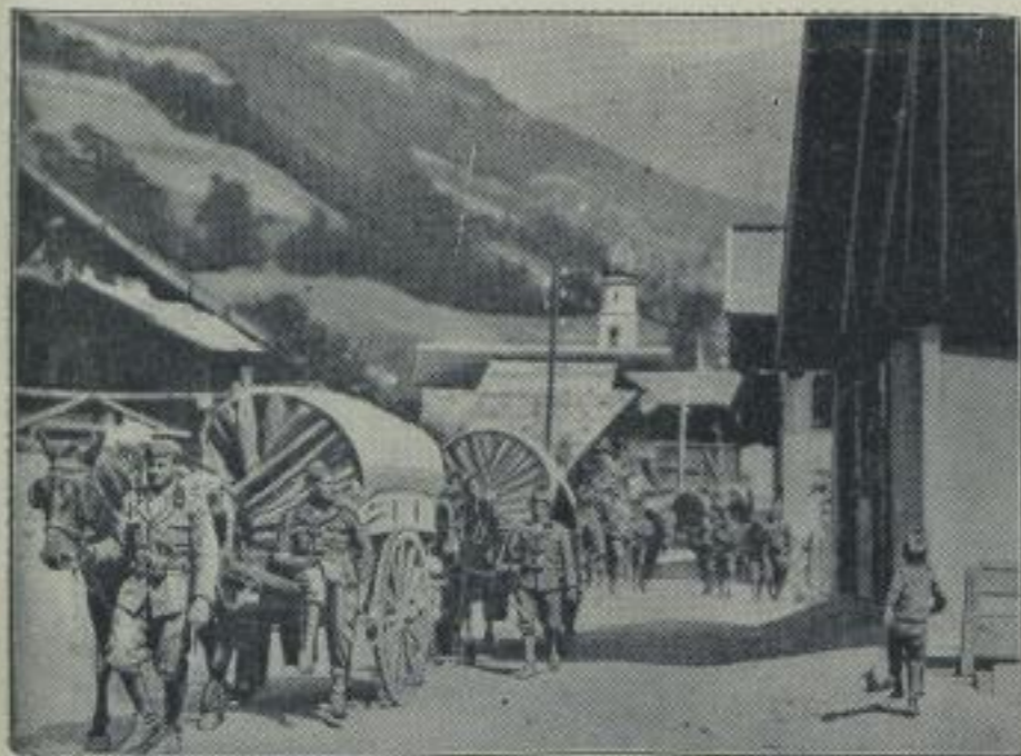
Italien zieht seine Truppen vom Brenner zurück.

Die ersten Versuche mit einem schwanzlosen Militärflugzeug in England sind nunmehr abgeschlossen. Durch das Wegfallen des Schwanzes und des hinteren Teiles des Rumpfes ist das Sicht- und Schussfeld dieses Zweiflüglers bedeutend erweitert worden.