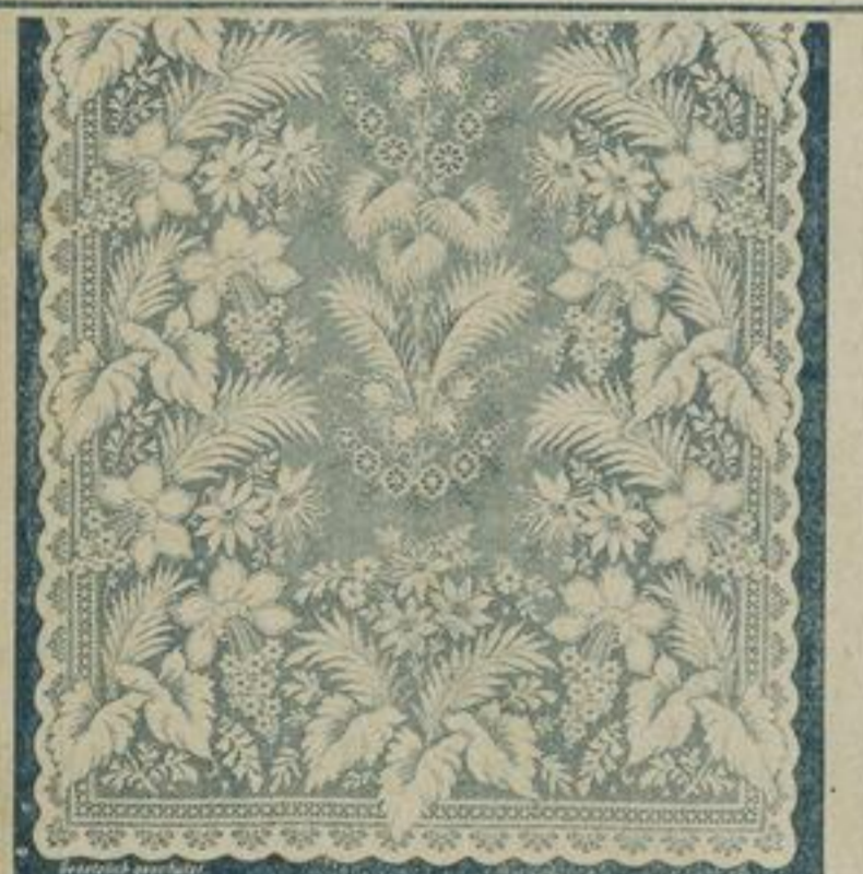
125 cm breit Englisch Tüll 5772 6,4 mtr. lang à mtr. 63 Pf. weiss und crème. à Fenster M. 4,40. Feingarnig und Bandeinfassung.