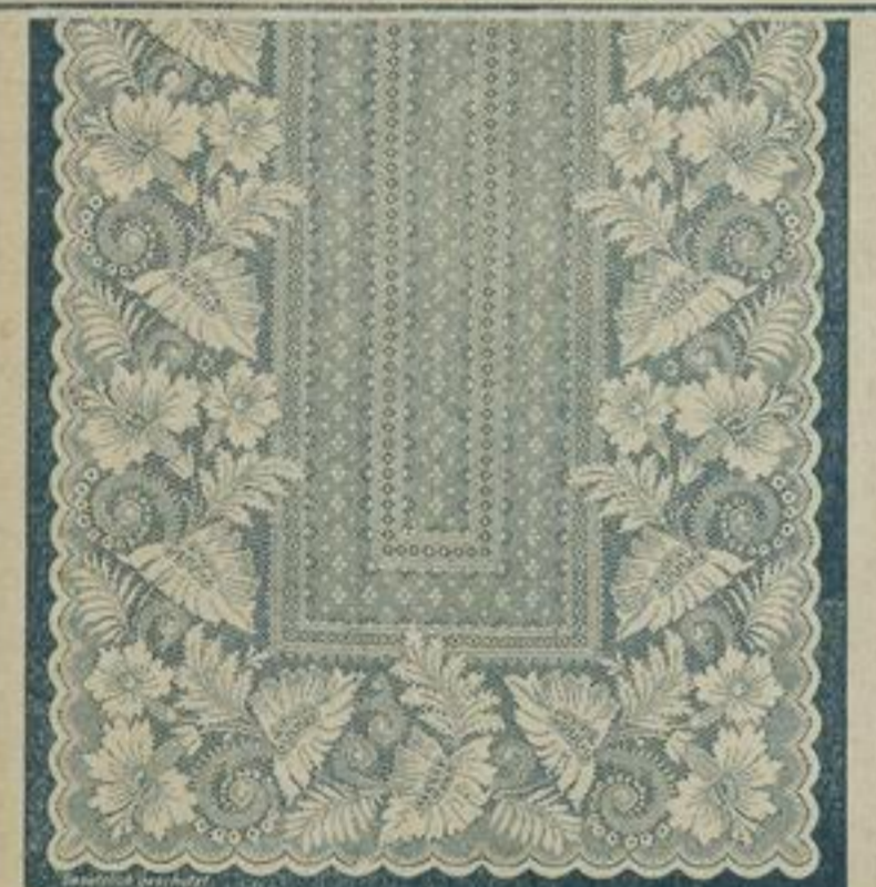
130 cm breit Englisch Tüll 5763 6,4 mtr. lang à mtr. 53 Pf. crème und weiss. à Fenster M. 4,—. Zweimal mit Band eingefasst.