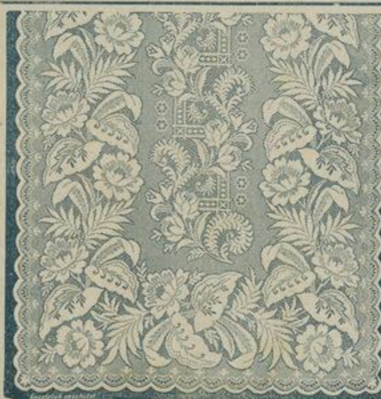
130 cm breit Englisch Tüll 5202 6,4 mtr. lang à mtr. 56 Pf. weiss und crème. à Fenster M. 4,—. Zweimal mit Band eingefasst.