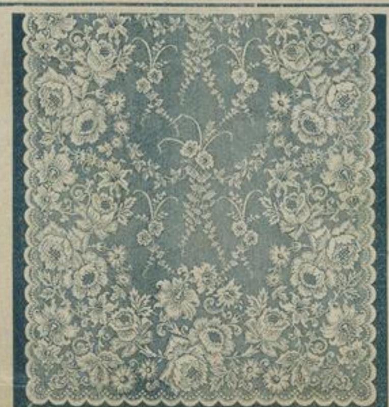
125 cm breit Englisch Tüll 5700 6,4 mtr. lang à mtr. 75 Pf. weiss und crème. à Fenster M. 5,—. Feingarnig und Bandeinfassung.