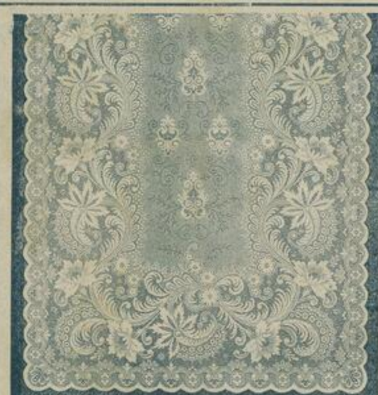
130 cm breit Englisch Tüll 5541 6,4 mtr. lang à mtr. 72 Pf. weiss und crème. à Fenster M. 5,—. Feingarnig und Band-infassung.