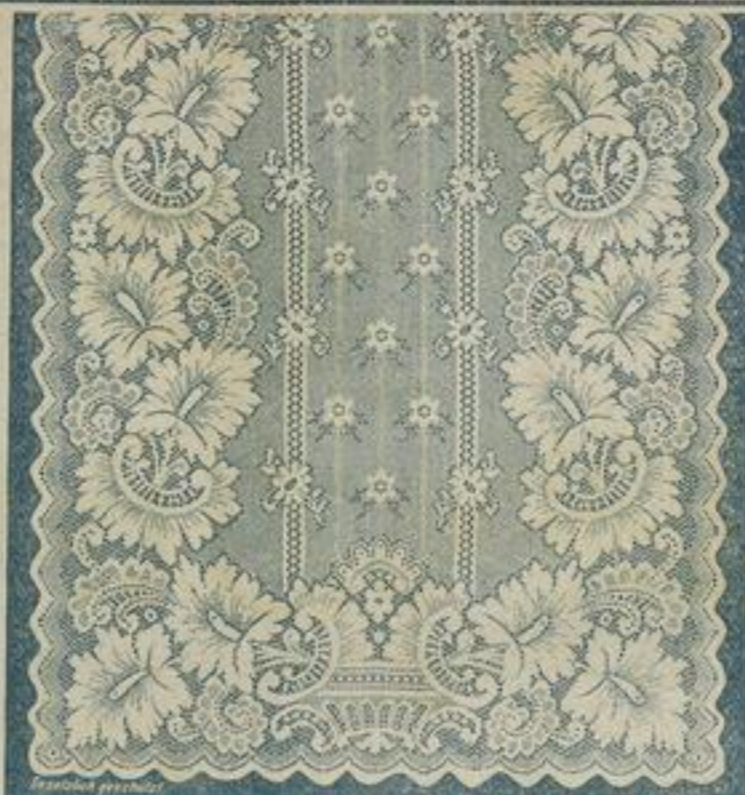
108 cm breit Englisch Tüll 5347 6,4 mtr. lang à mtr. 45 Pf. crème und weiss. à Fenster M. 3,50. Zweimal mit Band eingefasst.