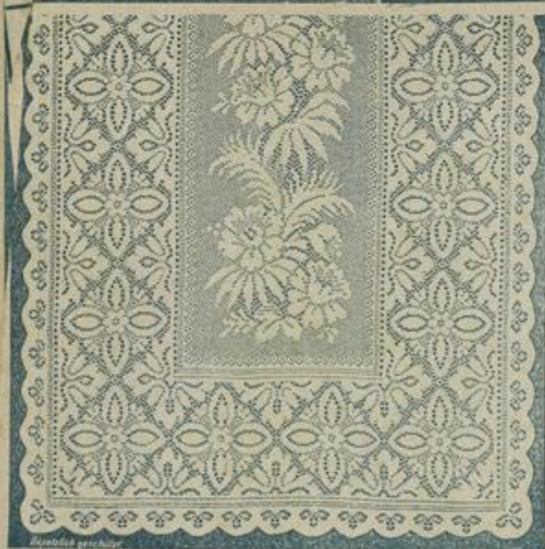
106 cm breit Englisch Tüll 5351 à mtr. 38 Pf. crème und weiss. Zweimal mit Band eingefasst.