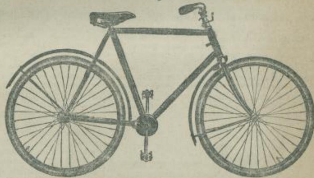
Brennabor-(kettenloses) Herrenrad No. 35.

Ausführung: Uebersetzung 78 oder auf Wunsch 72 Zoll, ovale Stahlkurbeln mit Konus-Befestigung, Doppel-Dickendspeichen, halbvernickelte Doppelhohlstahlfelgen, halbvernickelte Schmutzbleche, Brennabor-Kugellager D. R.-G.-M., feinsten vernickelter Sattel, Innenbremse, konische damascirte Lenkstange No. 2, Rahmentasche mit vollständigem Werkzeug. Die nahtlosen Scheiden der Vorderradgabel sind \infty geformt.