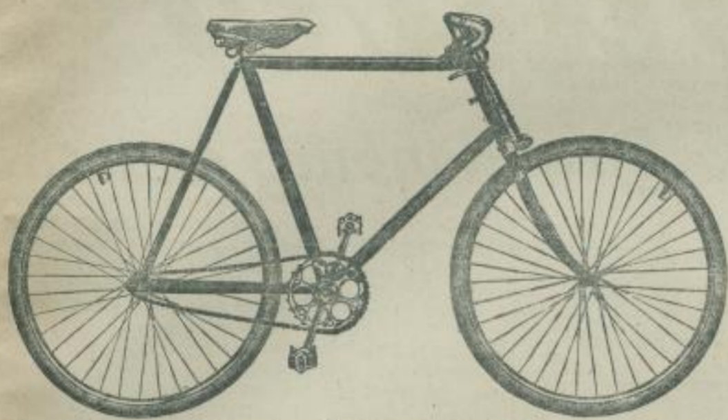
Brennabor-Halbrenner No. 1a.

Ausführung: Uebersetzung 82 Zoll, auf Wunsch 77 oder 88 Zoll, ovale Stahlkurbeln, Brennabor-Doppelglockenlager, Tiegelguss-Stahlspeichen, einfache schwarz emaillierte Stahlfelgen, Brennabor-Kugellager D. R.-G.-M., leicht auswechselbare Kettenräder, vernickelter Halbbrennsattel, \frac{3}{8} " Rollenkette, kräftige Handbremse, auf Wunsch Fußbremse, Halbbrennlenkstange No. 4, Rahmentasche mit vollständigem Werkzeug.