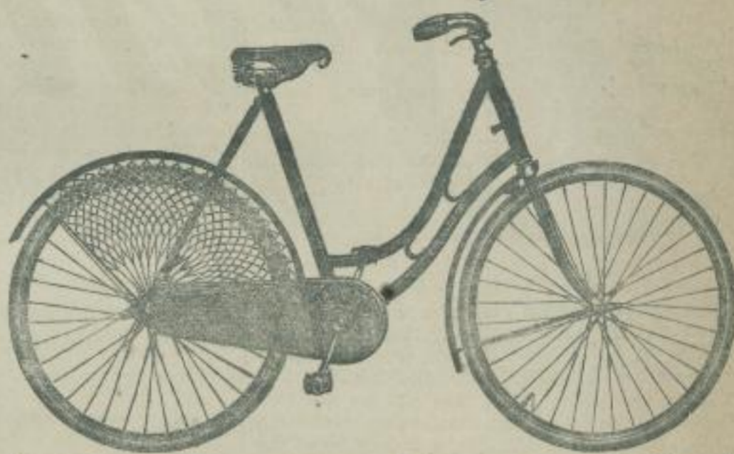
Brennabor-Damenrad No. 19.

Ausführung: Uebersetzung 71 Zoll, auf Wunsch 66 oder 76 Zoll, ovale Stahlkurbeln mit Konus-Befestigung, Brennabor-Doppelglockenlager, leicht auswechselbare Kettenräder, Doppel-Dickendspeichen, halbvernickelte Doppelhohlstahlfelgen, halbvernickelte Schmutzbleche, Brennabor-Kugellager D. R.-G.-M., \frac{3}{8} " Rollenkette, vernickelter Sattel, Innenbremse, konische damascirte Lenkstange No. 2, feine Netzverschnürung als Kleiderschutz, Celluloid-Kettenschutz D. R.-G.-M., Rahmentasche mit vollständigem Werkzeug. Die nahtlosen Scheiden der Vorder- und Hinterradgabeln sind \infty geformt.