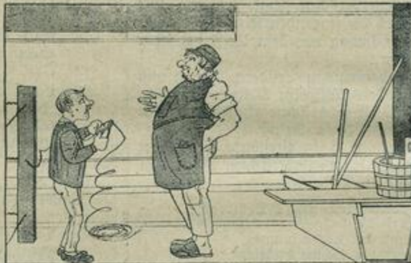
„Ne, lieber Aecner, so wird kein Draht nich gerade gemacht, sieh man her, ich will dir zeigen, wie det gemacht wird!“