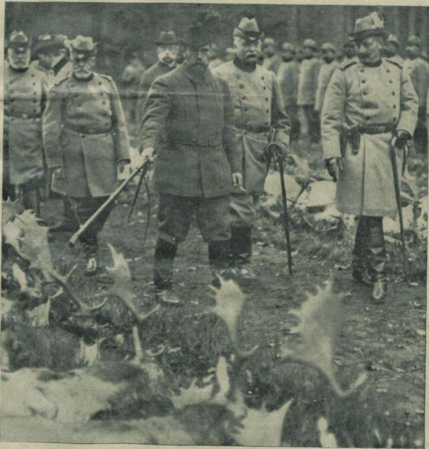
☛ Zar Nikolaus und Kaiser Wilhelm auf der Hofjagd. ☛ Besichtigung der Strecke.