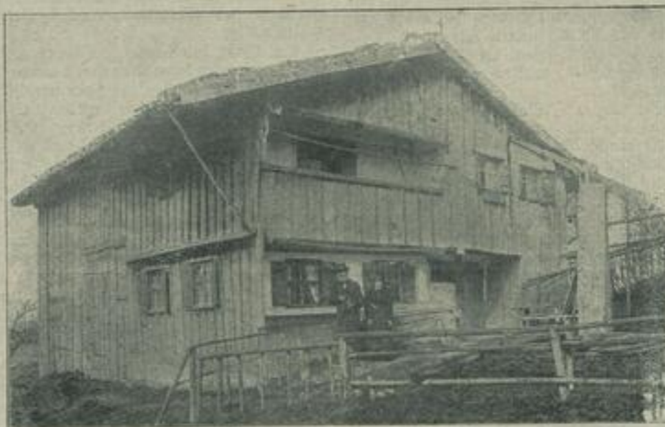
Das älteste Schulhaus in Deutschland.

Dieser Sportspiele sozusagen insondäbig machten. So verdankt ihnen das Tischtennis seine Entstehung und jetzt kommt wieder aus England ein neues Gesellschaftsspiel, das eine Variation des Tischtennis darstellt. Auf dem Mittelweg befinden sich kleine löcherartige Ränge und der Spieler muß vermeiden, daß sein Ball von diesen aufgefangen wird. Das neue Spiel hat in England Ping-Pong vollständig verdrängt und wird mit großer Leidenschaft betrieben. Unser oberes Bild zeigt uns dieses neuartige Spiel, das ein großes Maß von Geschicklichkeit erfordert.