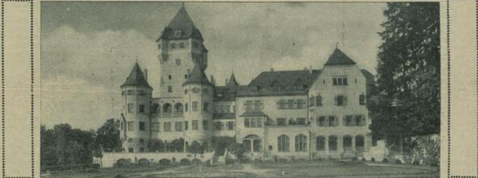
Das großherzogliche Schloß Berg. Zum Thronwechsel in Luxemburg.