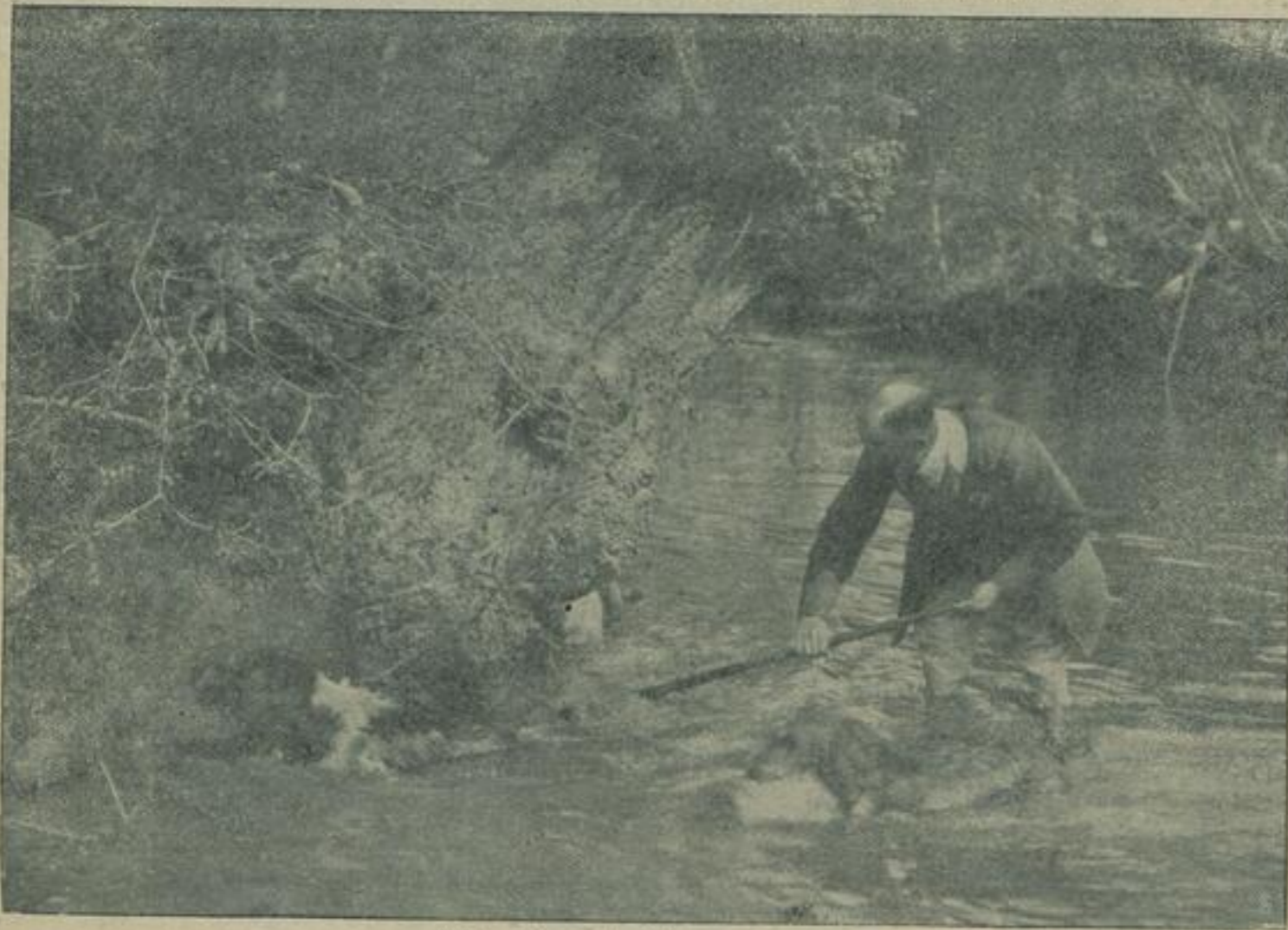
Auf der Otterjagd: Die Meute am Bau.

einzigste Mittel, wodurch die nordibirischen Nomadenvölker, die Esjakten, Kulahiren, Jakuten, Tanguusen, Samojeden, sich Geld verdienen können; er nimmt dafür ihre ganze Erfindungskraft und ihre hauptsächlichste Tätigkeit in Anspruch.