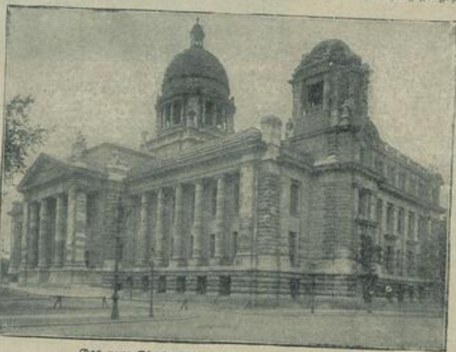
Das neue Oberlandesgerichtsbau in Hamburg.

und sie wird sich auch in Zukunft ständig den Verkehrs- fordernissen an- zupassen verstehen. — Bei dem ganz enormen Handelsverkehre der Han- sstädte ist es wohl kein Wunder, daß das hanseatische Oberlandes- gericht in Hamburg von Jahr zu Jahr mehr zu tun bekommt. Denn ohne Prozesse geht es nun einmal im Geschäftsleben gar nicht ab. Infol- gedessen waren die Räumlichkeiten, in denen das Oberlandesgericht untergebracht war, schon seit Jahren zu eng geworden. Es wurde deshalb ein neuer Monu- mentalbau errich- tet, den unsere untere Abbildung wiedergibt. Der von einer Kuppel ge- krönte Renaissance- bau gehört un- streitig zu den hervorragendsten Bauwerken, die in den letzten Jahren in Deutschland er- richtet wurden, er bildet eine Herde der schönen Stadt Hamburg.