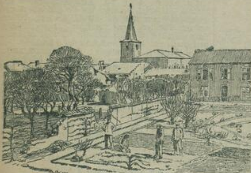
Der Ort Essey im Mork-Mare-Wald.