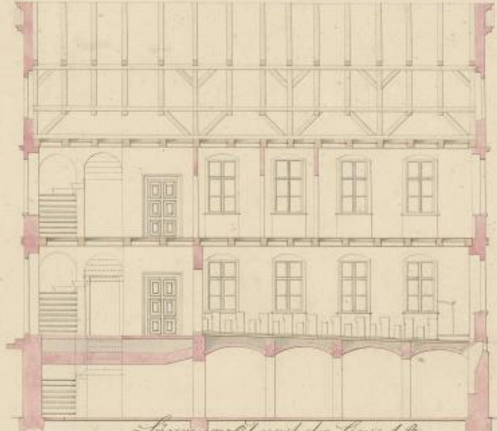
Längsprofil nach der Linie A-A