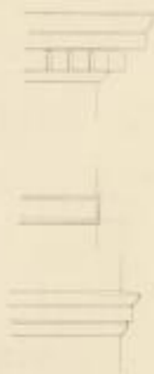
Durchschnitt nach der Linie A-B