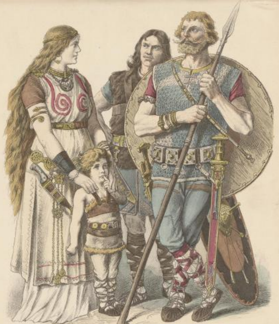
Drittes bis viertes Jahrhundert.

Münchener Bilderbogen. 5. Auflage. (Alle Rechte vorbehalten.)