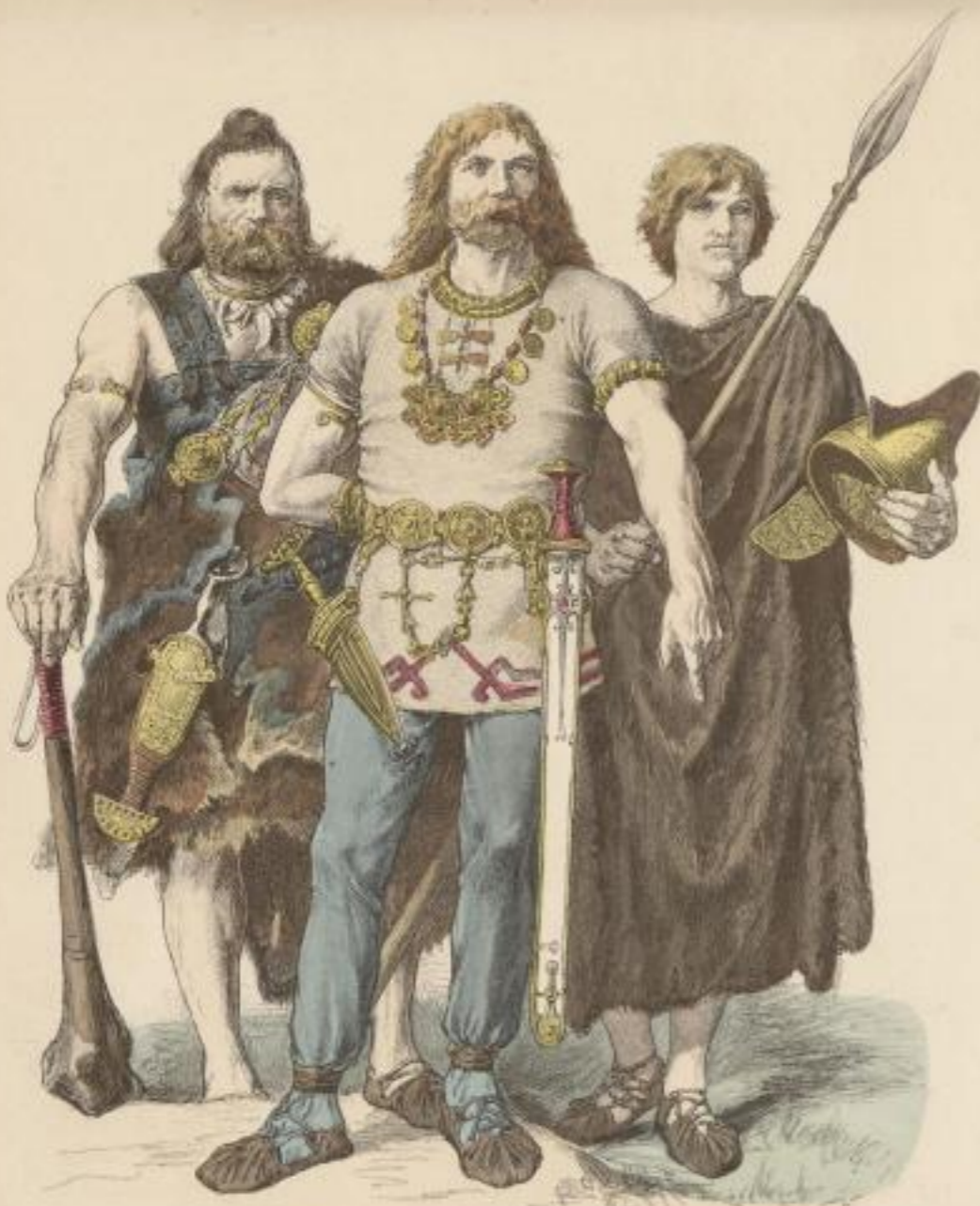
Beginn der christlichen Zeitrechnung.