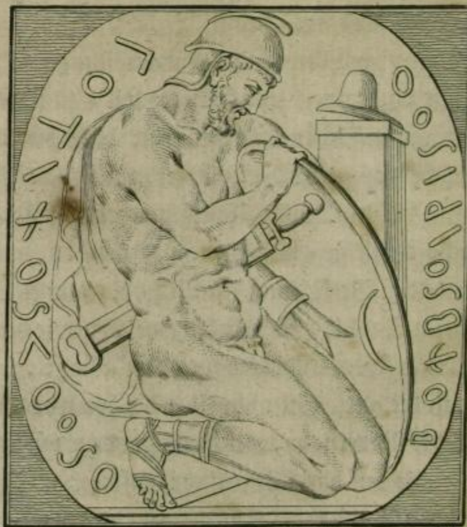
Gemma Mus. Florent. insignis Sculpturae, recentius in scripta, & propterea a Goriō inter Abraxas dictas collōcata, perperamq; delineata.

Dieses kann zur Absicht dieses Entwurfs, welcher allgemein seyn sollte, hinlänglich geachtet werden. Die höchste Deutlichkeit kann Dingen, die auf der Empfindung bestehen, nicht gegeben werden, und hier läßt sich schriftlich nicht alles lehren, wie unter andern die Kennzeichen beweisen, welche Argenville in seinen Leben der Maler von den Zeichnungen derselben zu geben vermeynet. Hier heißt es: gehe hin und sieh; und Ihnen, mein Freund, wünsche ich wieder zu kommen. Dieses war Ihr Versprechen, da ich Ihren Namen in die Rinde eines prächtigen und belaubten Ahorns, zu Frascati, schnitt, wo ich meine nicht genutzte Jugend in Ihrer Gesellschaft zurück rief, und dem Genius opferte. Erinnern Sie sich desselben und Ihres Freundes: genießen Sie Ihre schöne Jugend in einer edlen Belustigung, und ferne von der Thorheit der Hofe, damit Sie sich selbst leben, weil Sie es können, und erwecken Sie Söhne und Enkel nach ihrem Bilde.